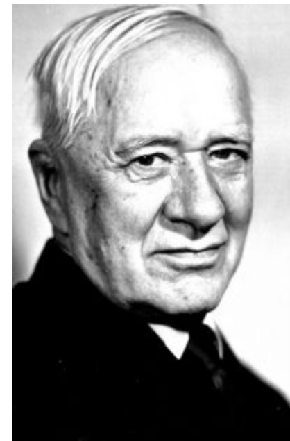
Корней Иванович Чуковский

Подготовила: Воспитатель МКОУ «Левороссошанская СОШ»