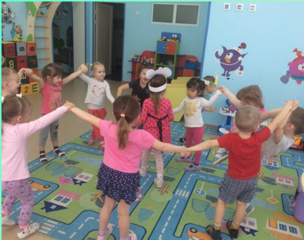
Подвижная игра «Мышеловка»