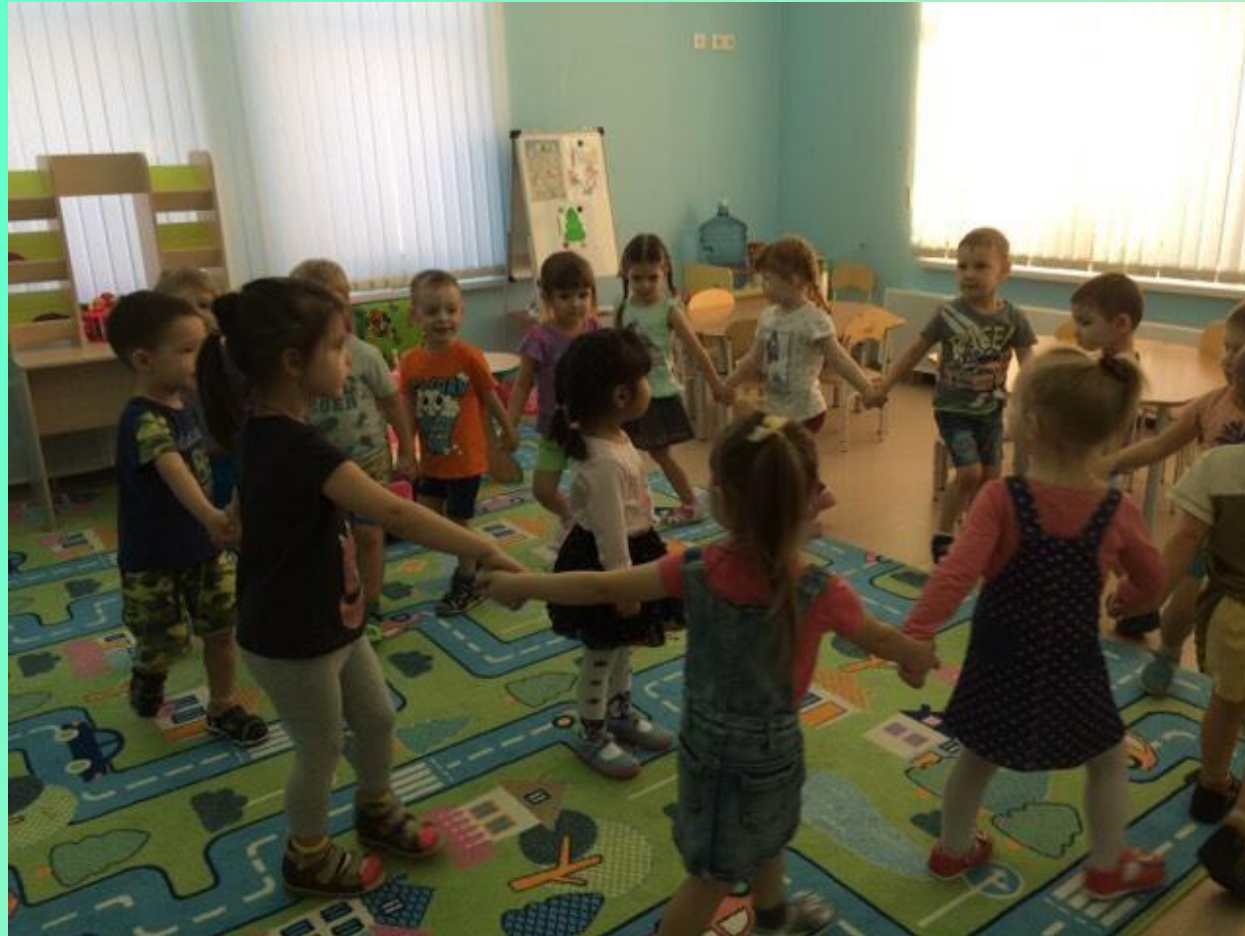
Подвижная игра «Каравай»