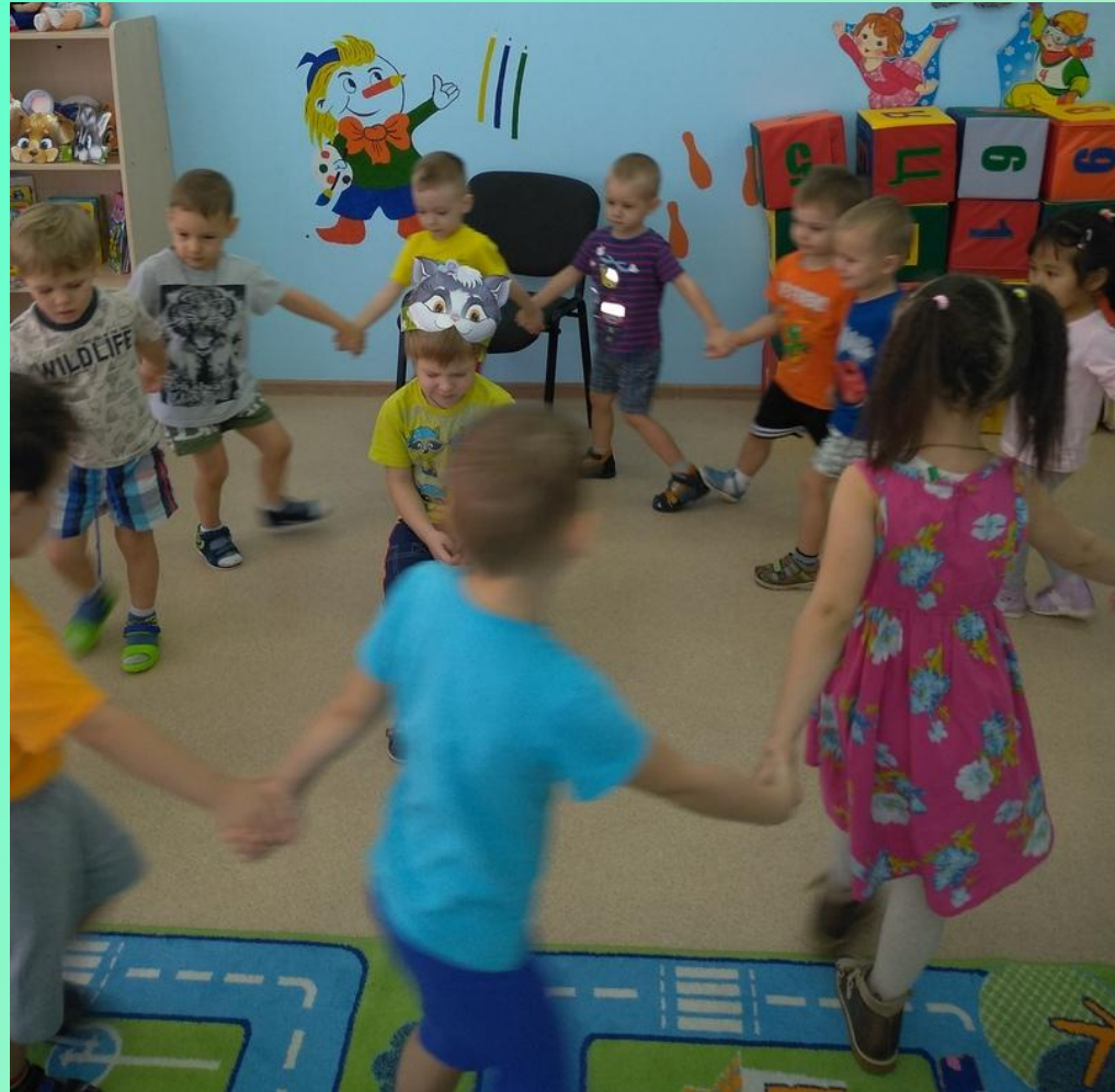
Подвижная игра «Водяной»