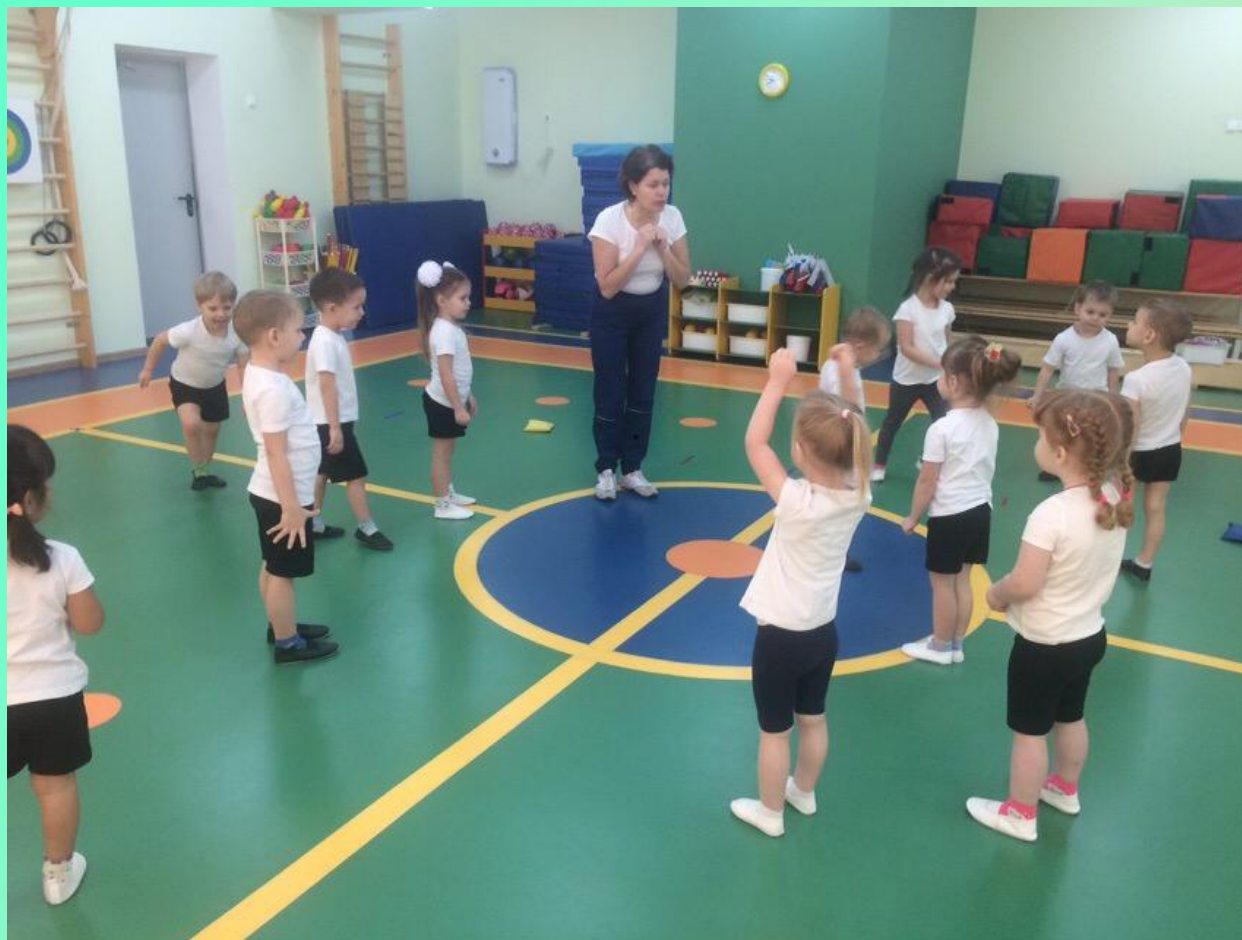
Подвижная игра «Бабочка и паук»