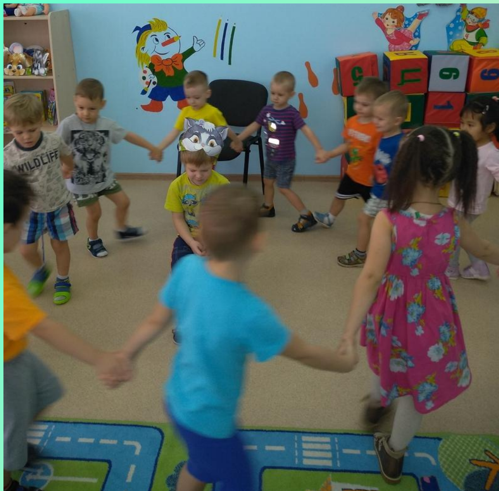
Подвижная игра «Водяной»