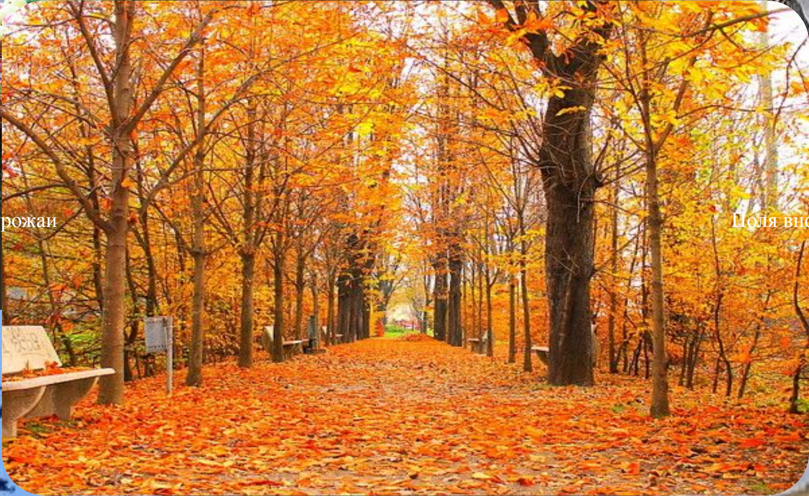
Поля вновь засеваю