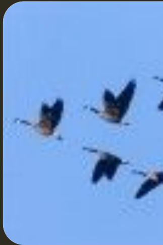
Птиц к югу отправляю