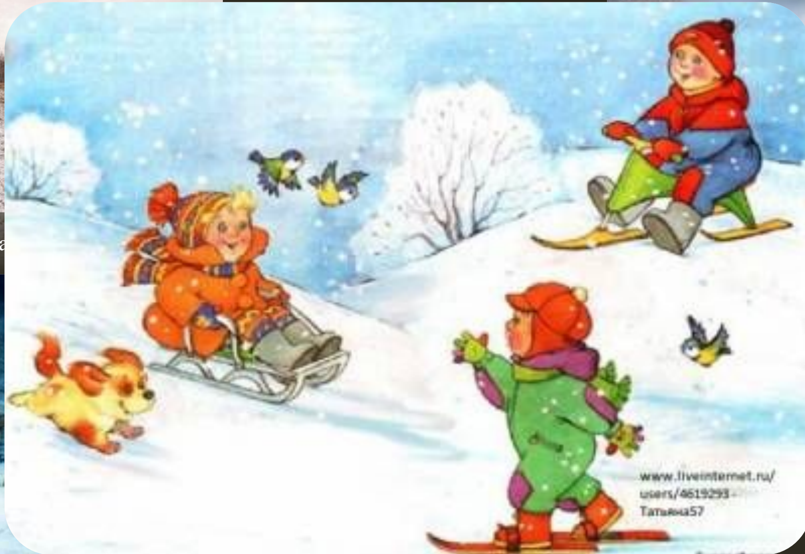
Когда это бывает