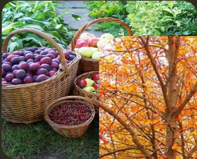
Несу я урожаи