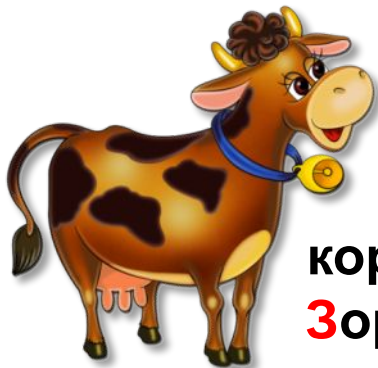
корова З орька