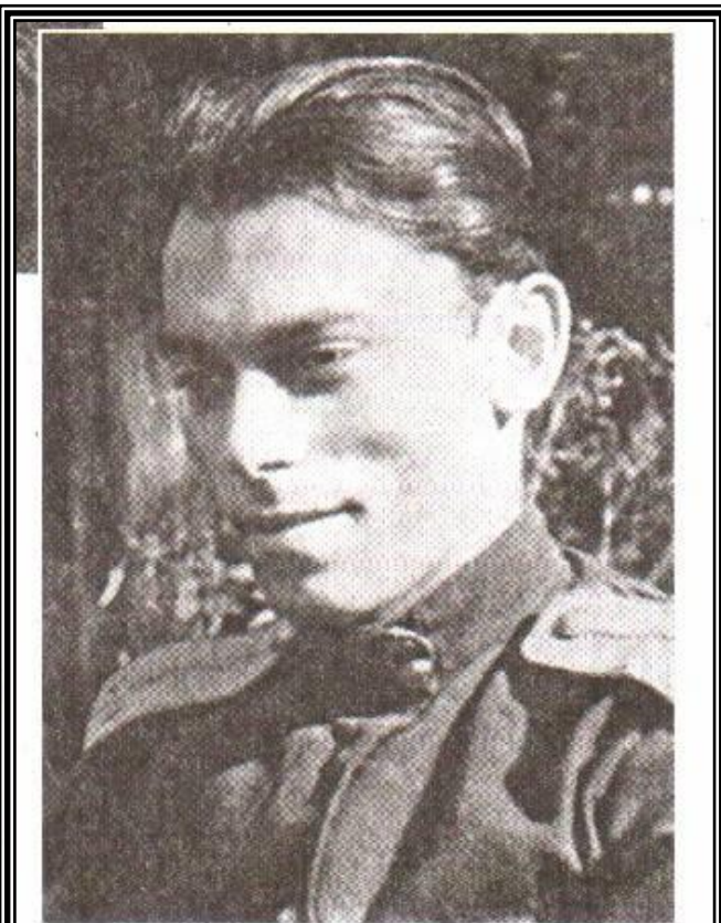
Старший лейтенант Борис Заходер. 1944 г.

В годы Великой Отечественной войны добровольцем уходит на фронт. По окончании войны возвращается в Москву и заканчивает с отличием Литературный институт.