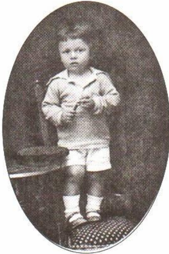
Боря Заходер. 1920 год.

Родился в городе Кагуле в Молдавии. По собственному признанию, был очень «приличным мальчиком». Он не только не играл в футбол, но даже почти не дрался. Драться он не любил, зато всё время читал и ещё ... очень любил животных.