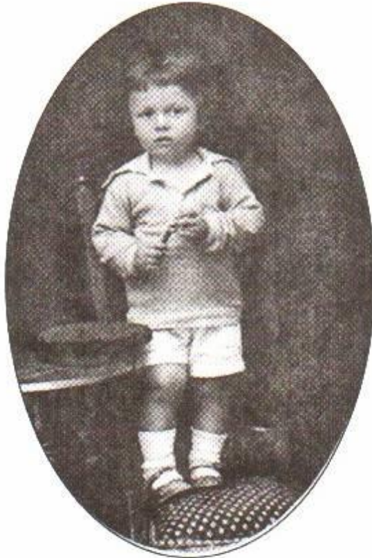
Боря Заходер. 1920 год.

Родился в городе Кагуле в Молдавии. По собственному признанию, был очень «приличным мальчиком». Он не только не играл в футбол, но даже почти не дрался. Драться он не любил, зато всё время читал и ещё ... очень любил животных.