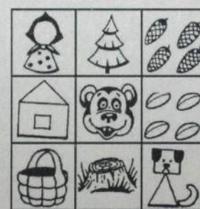
Маша и Медведь