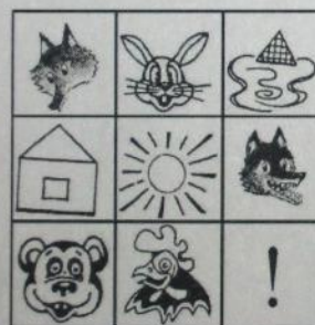
Лиса и Заяц