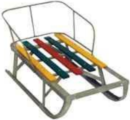
3D rendering, 14x10x10 cm (included) (10x10x10 cm)