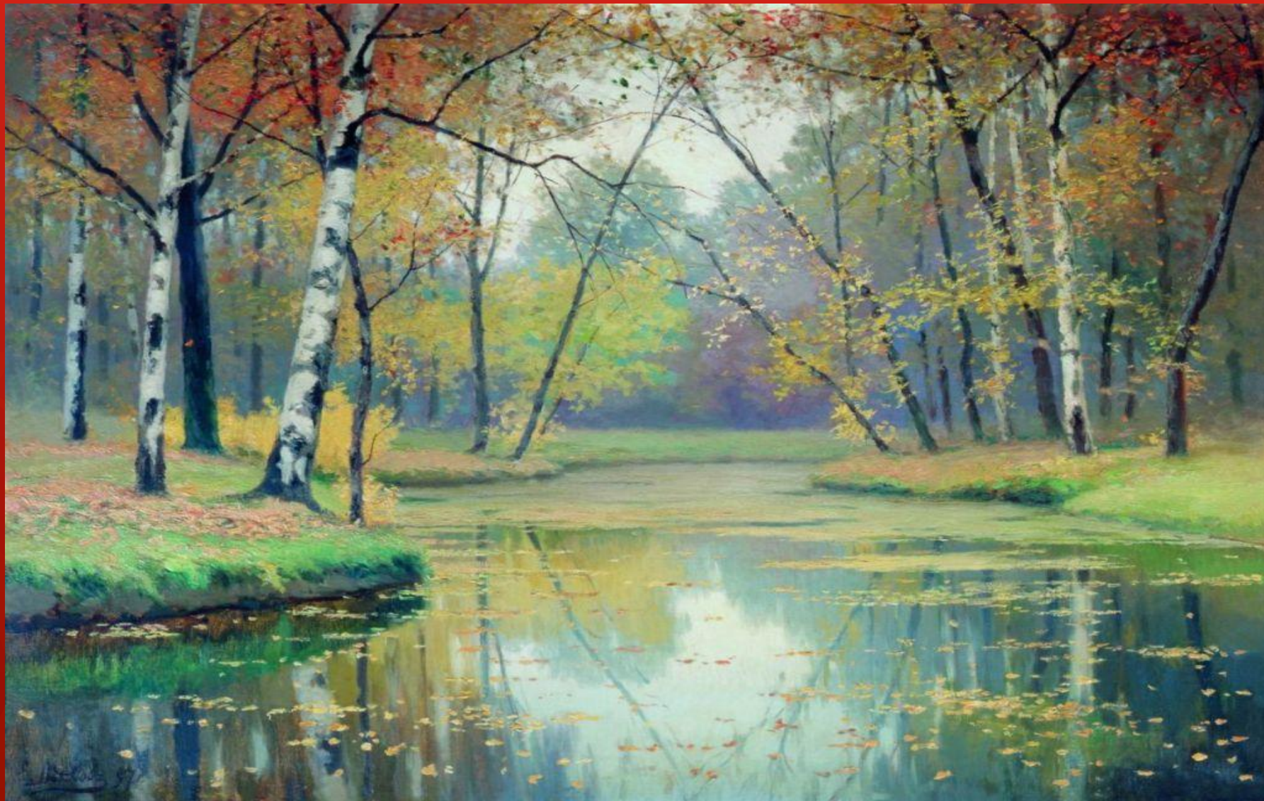
ОСЕННИЙ ПЕЙЗАЖ. ВОЛКОВ Е. Е.