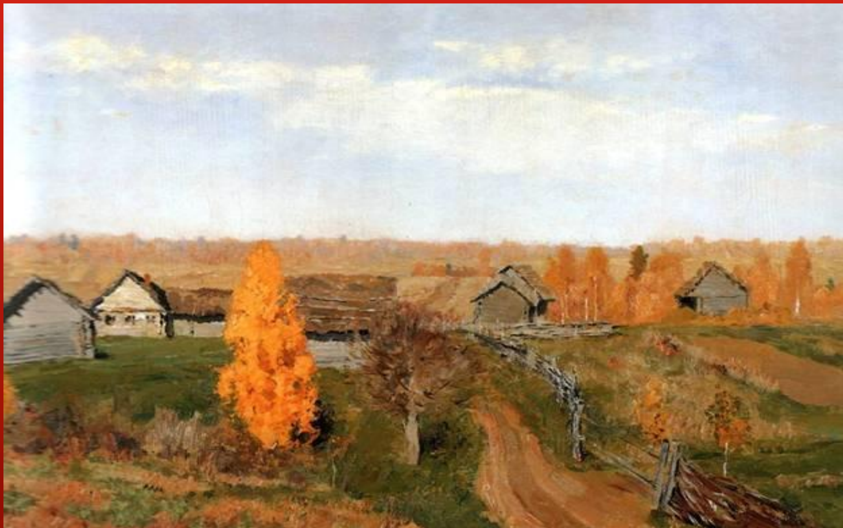
ЗОЛОТАЯ ОСЕНЬ. СЛОБОДКА. ЛЕВИТАН И. И. 1889г.