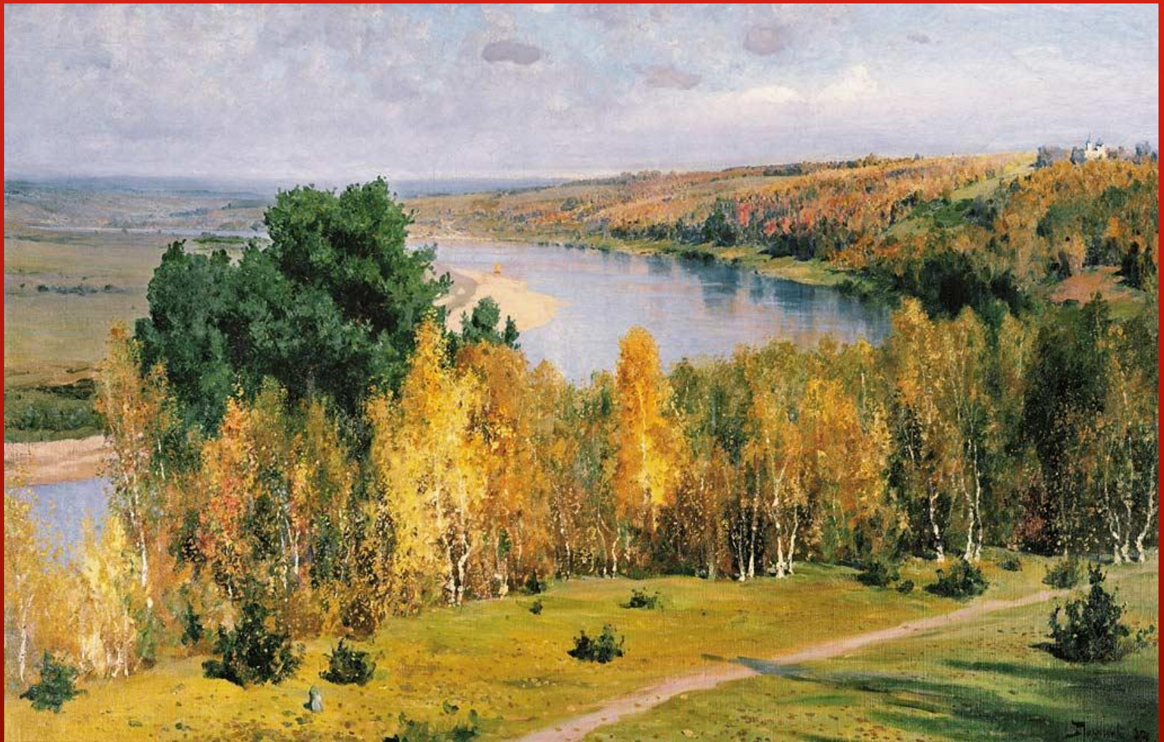
ЗОЛОТАЯ ОСЕНЬ. ПОЛЕНОВ В. Д. 1893Г.