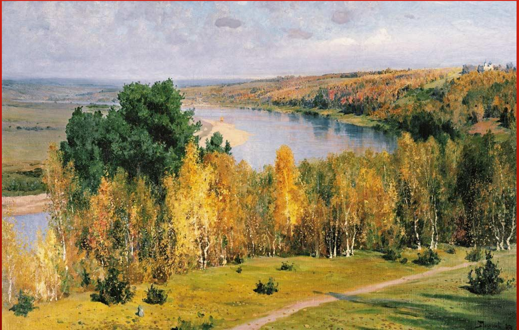
ЗОЛОТАЯ ОСЕНЬ. ПОЛЕНОВ В. Д. 1893Г.