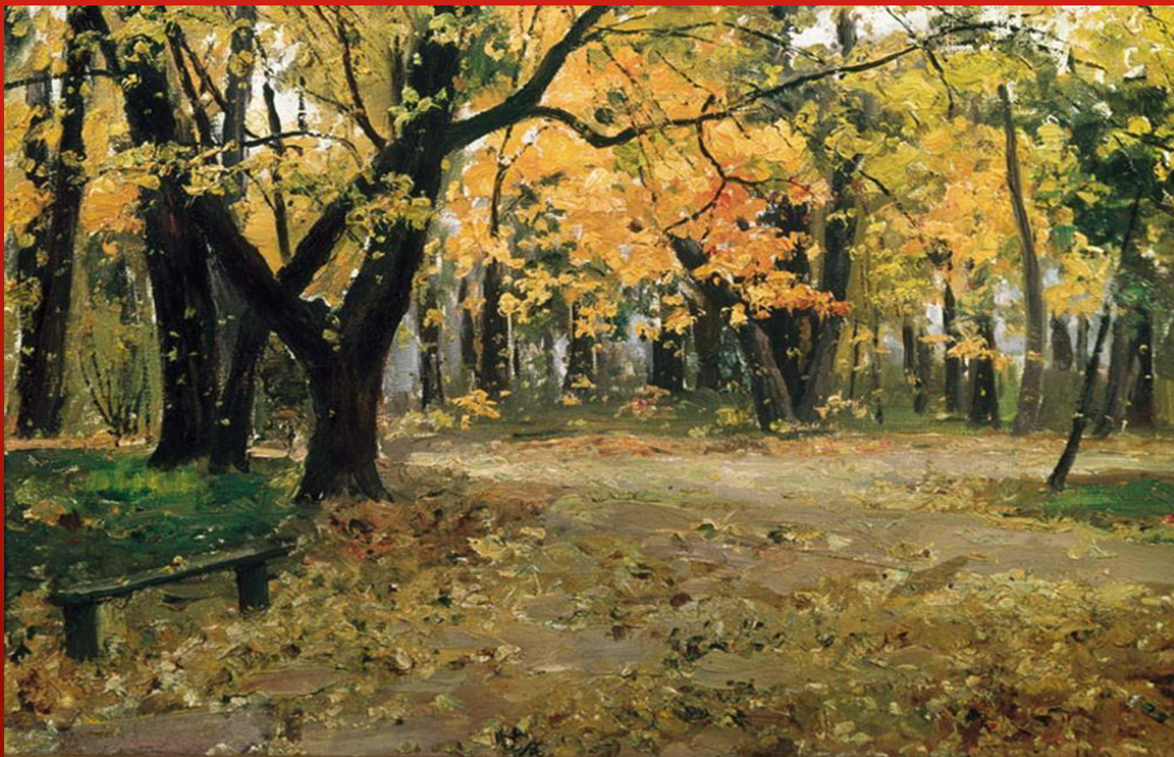
В АБРАМЦЕВСКОМ ПАРКЕ. ОСТРОУХОВ И. С.