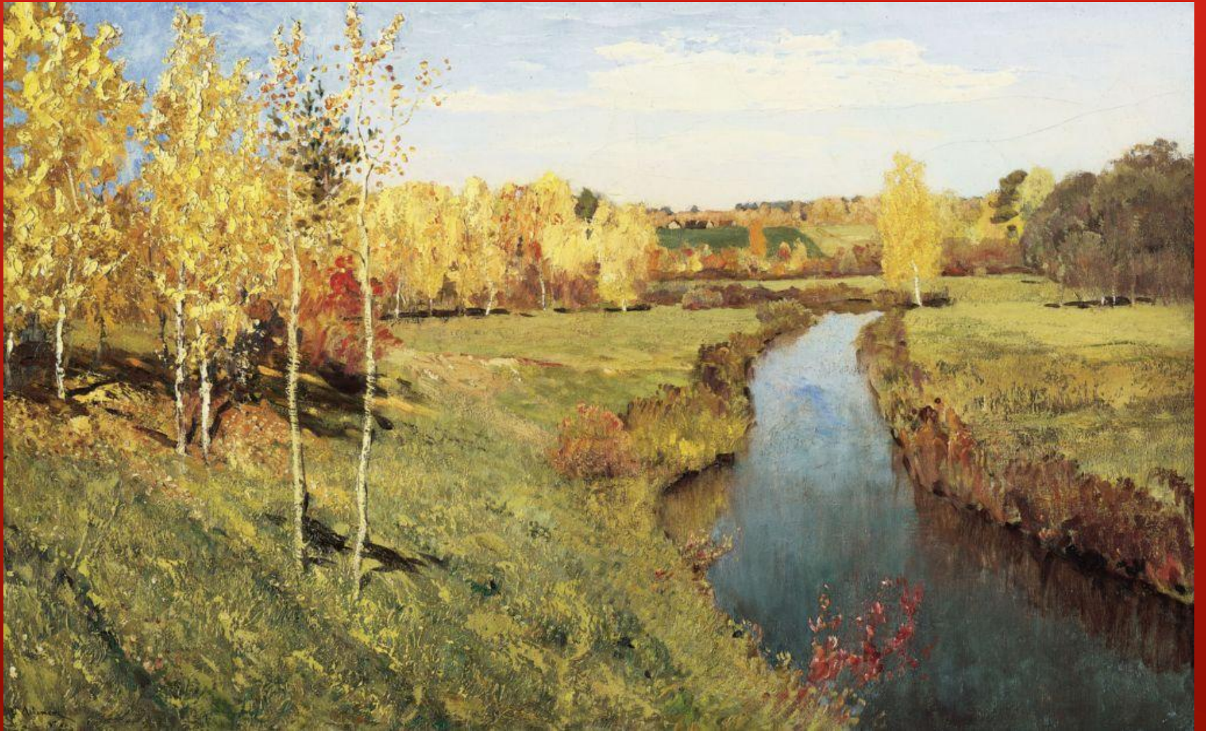
ЗОЛОТАЯ ОСЕНЬ. ЛЕВИТАН И. И. 1895г.