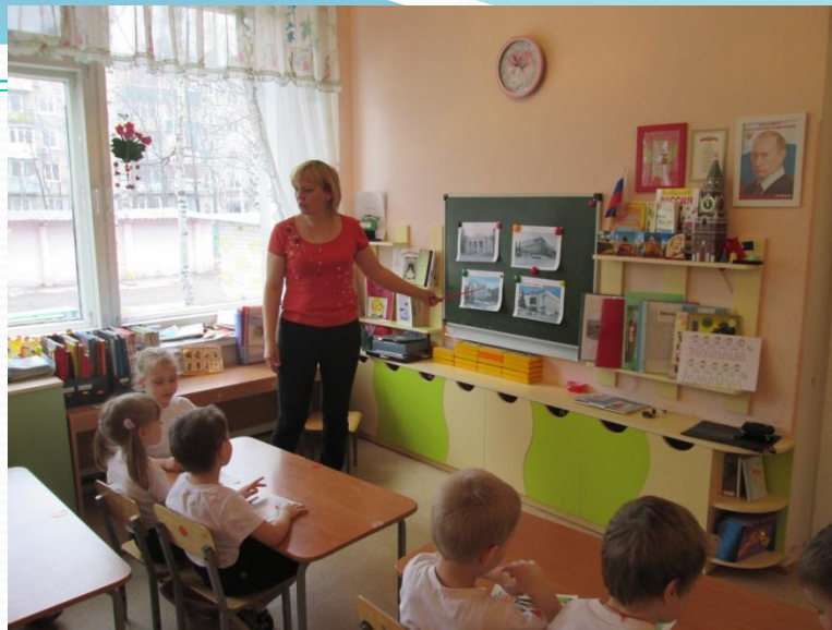
НОД : «Ознакомление с театрами города»