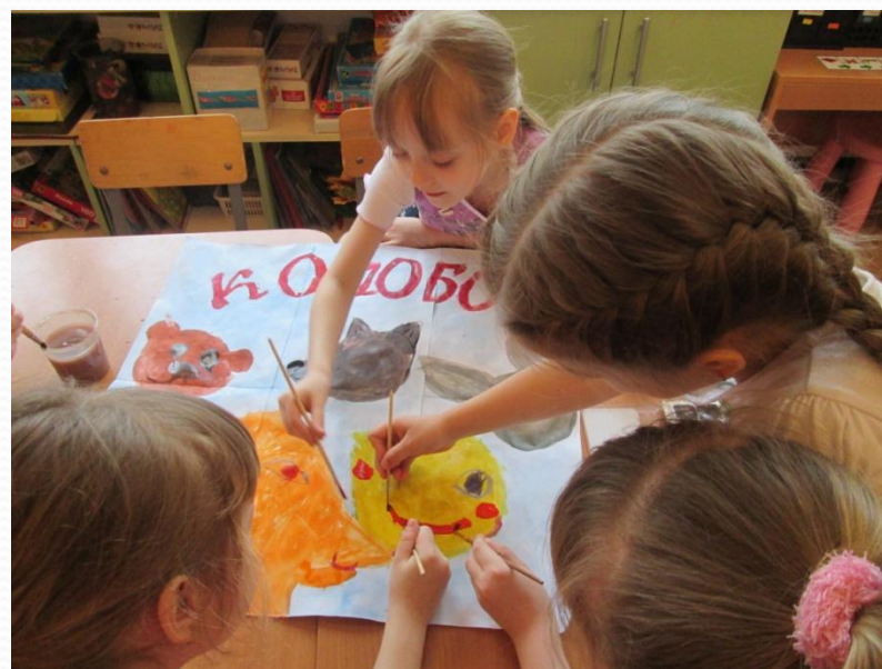
НОД :Рисование «Изготовление афиши к спектаклю «Колобок»