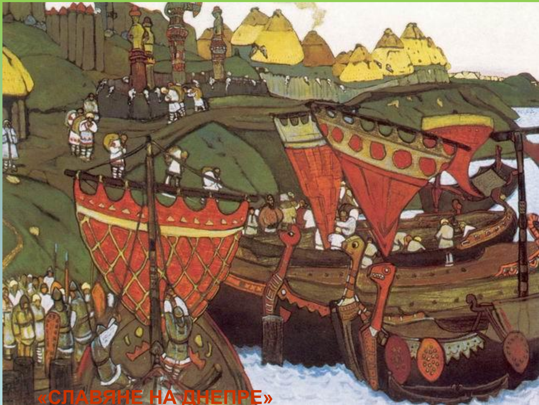
«СЛАВЯНЕ НА ДНЕПРЕ»