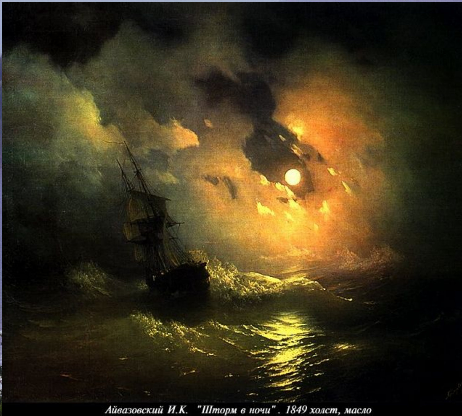
Айвазовский И.К. "Шторм в ночи". 1849 холст, масло