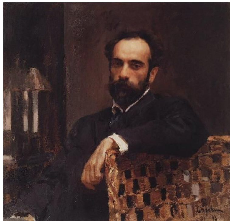
В.Серов. Портрет И. Левитана

"Картины Левитана это - его задушевные песни, изображенные красками на полотне." (Сизов В.Е.)