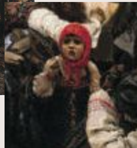
В.И. Суриков Утро стрелецкой казни