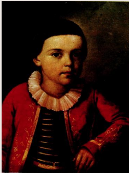
Неизвестный художник М.Ю. Лермонтов в детстве