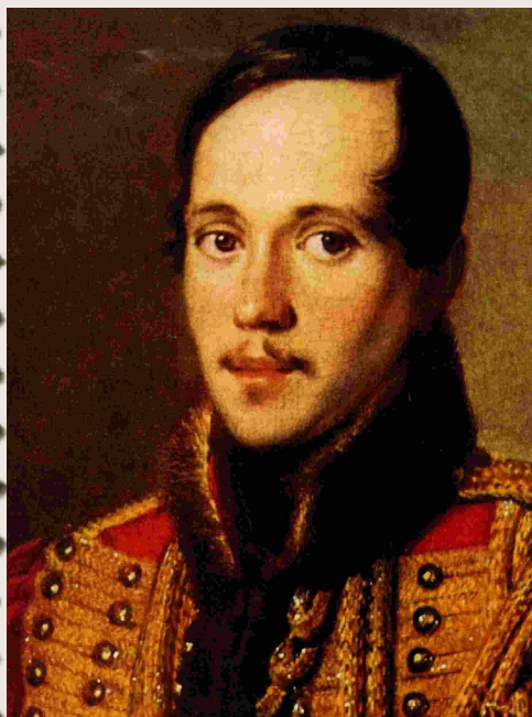
П.Е. Заболотский М.Ю. Лермонтов