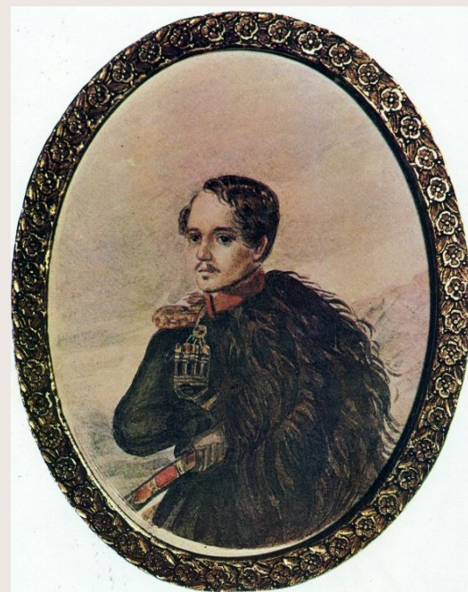
М.Ю. Лермонтов Автопортрет