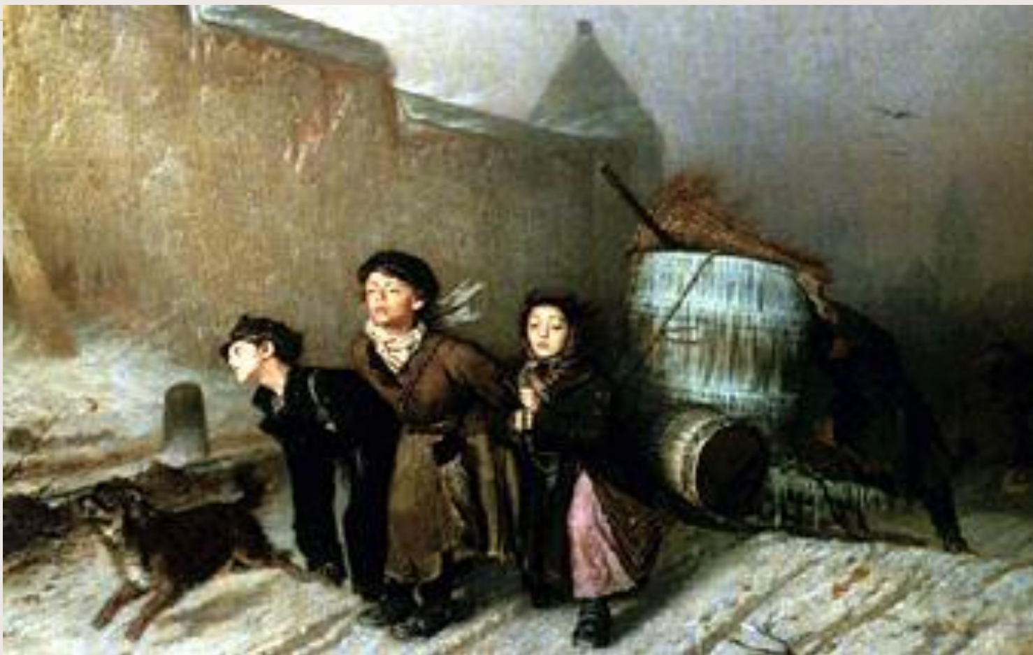
В.Г. Перов Тройка