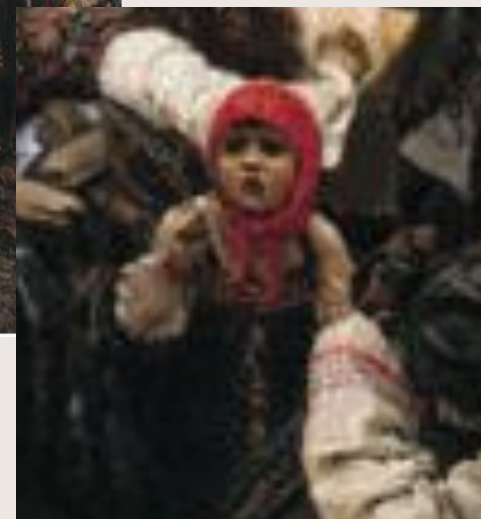
В.И. Суриков Утро стрелецкой казни