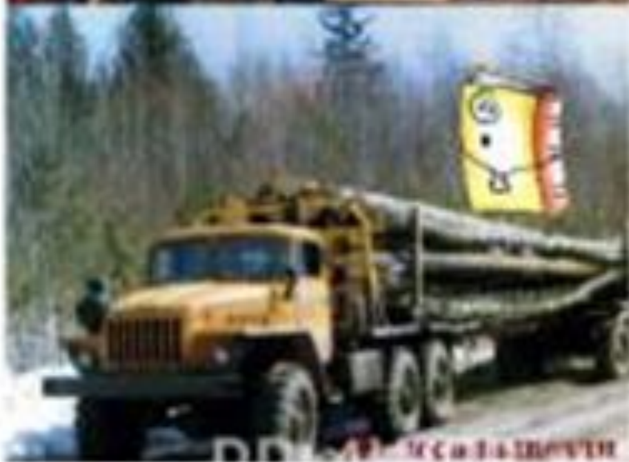
ДРД - ЛЕСОУБОРЩИК