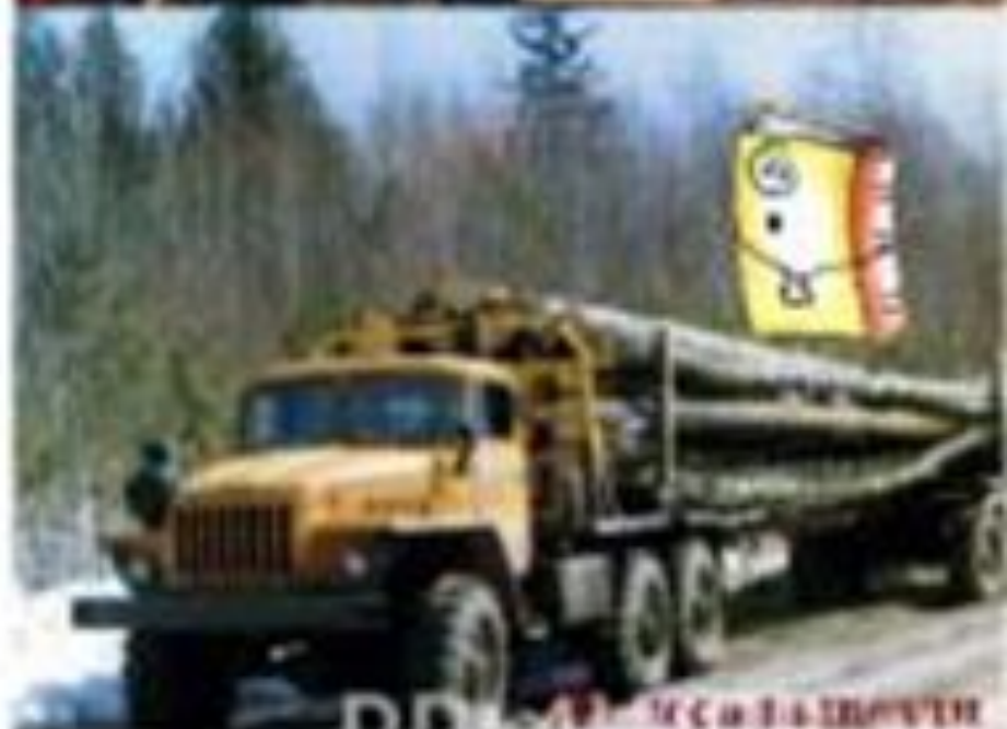
РД ЛЕСА ВАРШОВИ