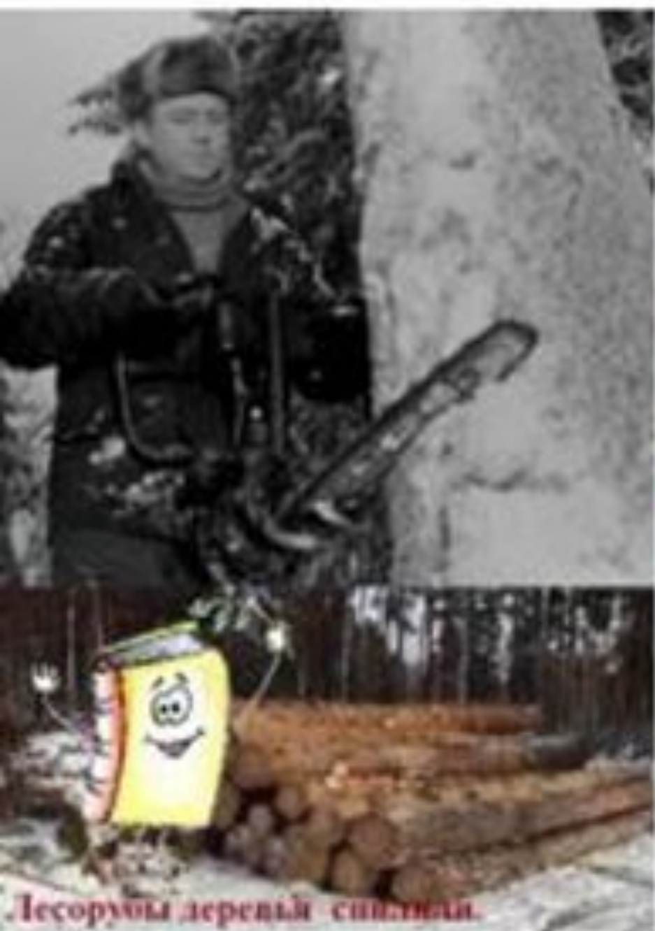
Лесорубы дерева счастливы.