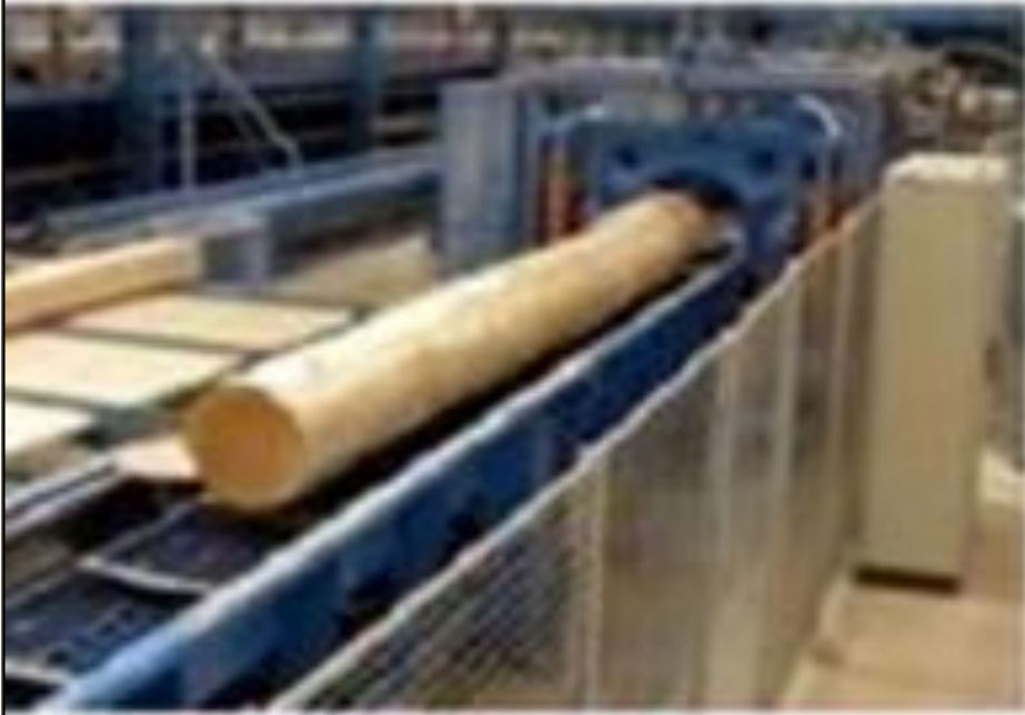
Деревья привезли на бумажную фабрику, очистили от коры, распилили, измельчили в опилки.