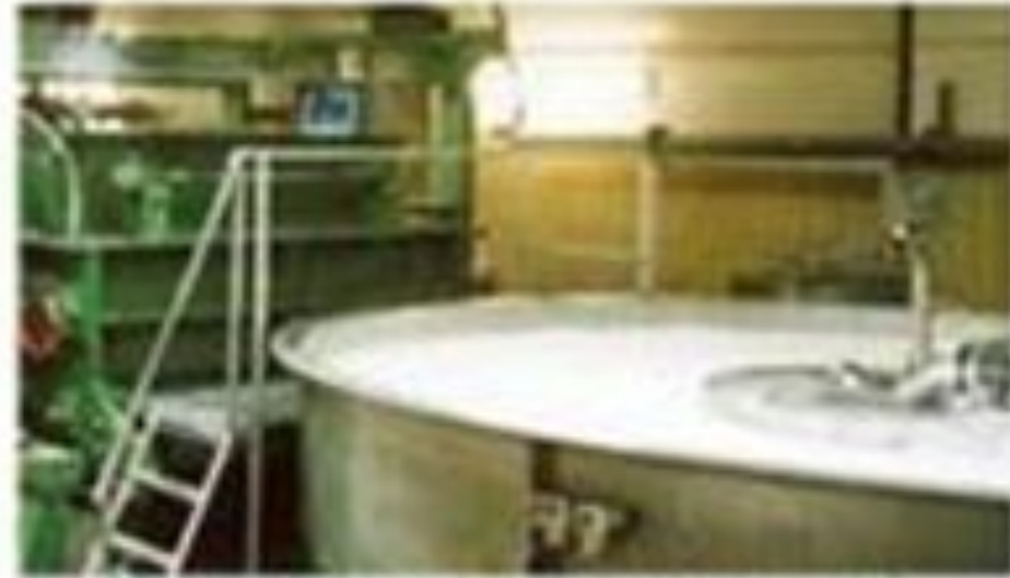
Опилки старели, чтобы получить массу, похожую на жидкое тесто. Древесные тесты раскатывают в длинные широкие полосы. Сырая бумажная лента проходит через целый ряд вальцов. Одни вальцы нагревают воду, другие высушивают ленту, третьи полируют.