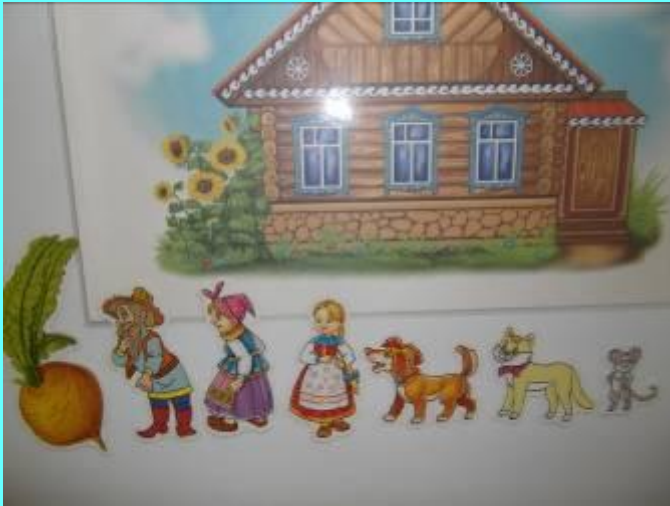
«Настольный театр» Сказка «Репка»