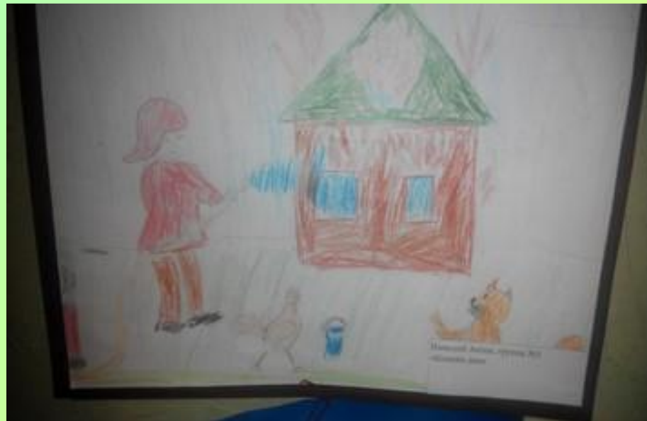
Рисунки детей подготовительной группы №5