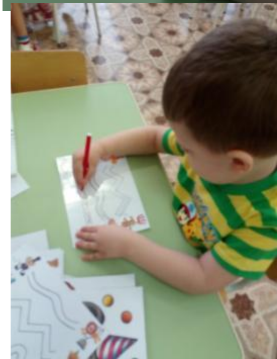
Помогали артистам цирка найти себе друга.