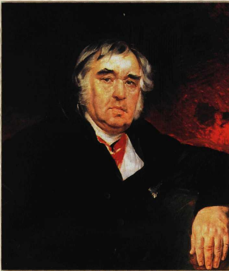
Иван Андреевич Крылов ( 1769-1844 )