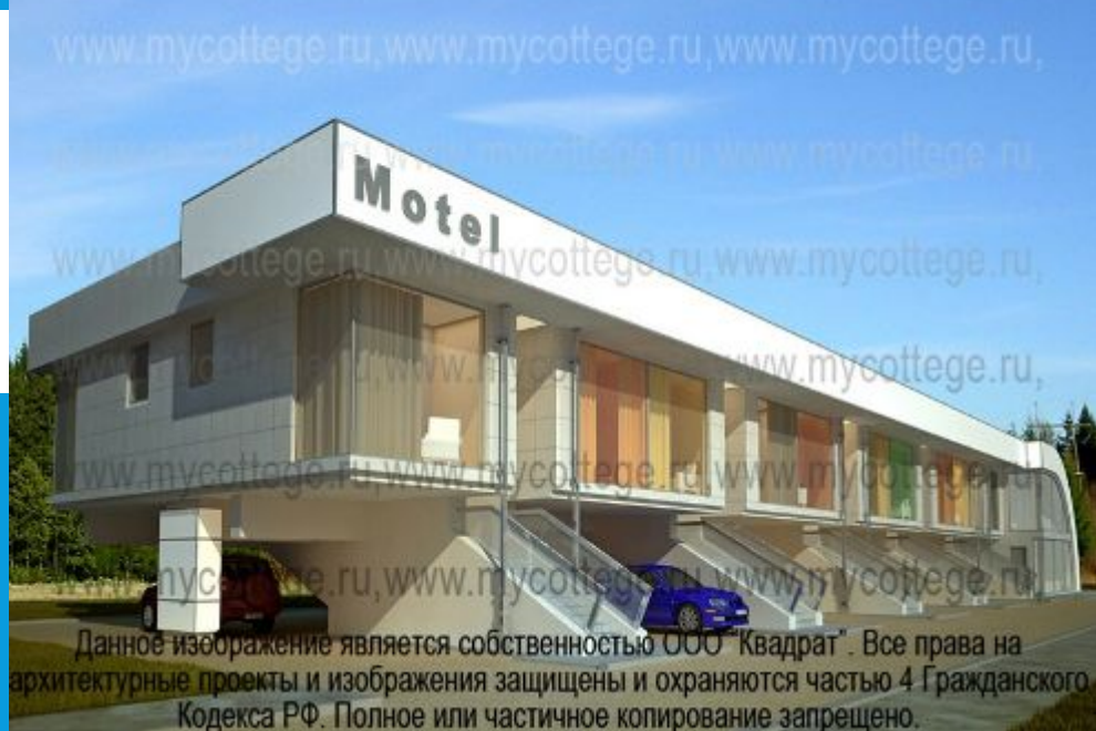
Данное изображение является собственностью ООО "Квадрат". Все права на архитектурные проекты и изображения защищены и охраняются частью 4 Гражданского Кодекса РФ. Полное или частичное копирование запрещено.