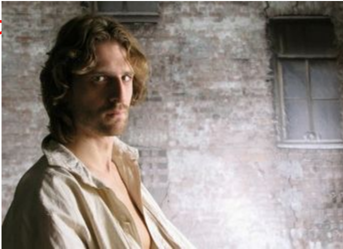
Родион Раскольников из романа «Преступление и наказание».

1) Раскольников разглядел худенькое, но милое личико девочки, улыбавшееся ему и весело на него смотревшее. (Осложнено однородными членами и обособленными