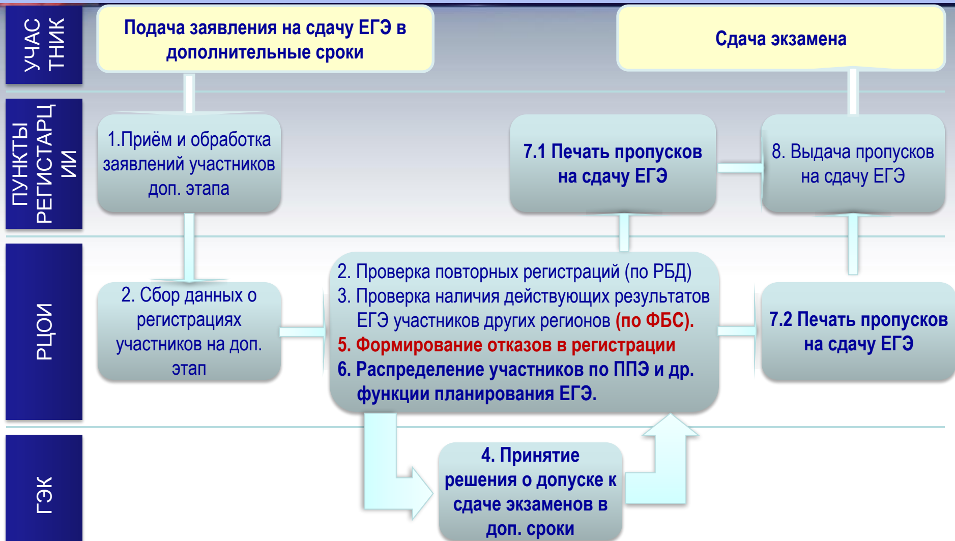
Схема регистрации участников и планирования проведения ЕГЭ в дополнительные сроки

Пункты регистрации участников дополнительного этапа могут создаваться на базе: