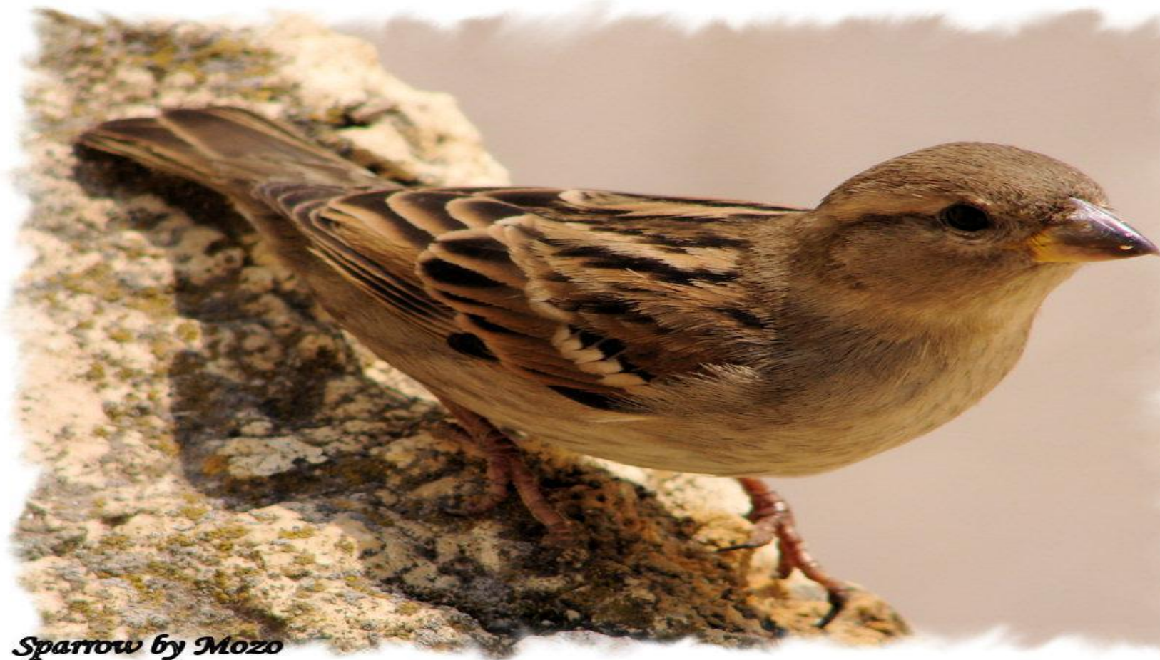
Sparrow by Mozo