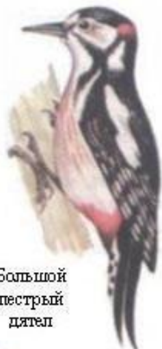
Большой пестрый дятел