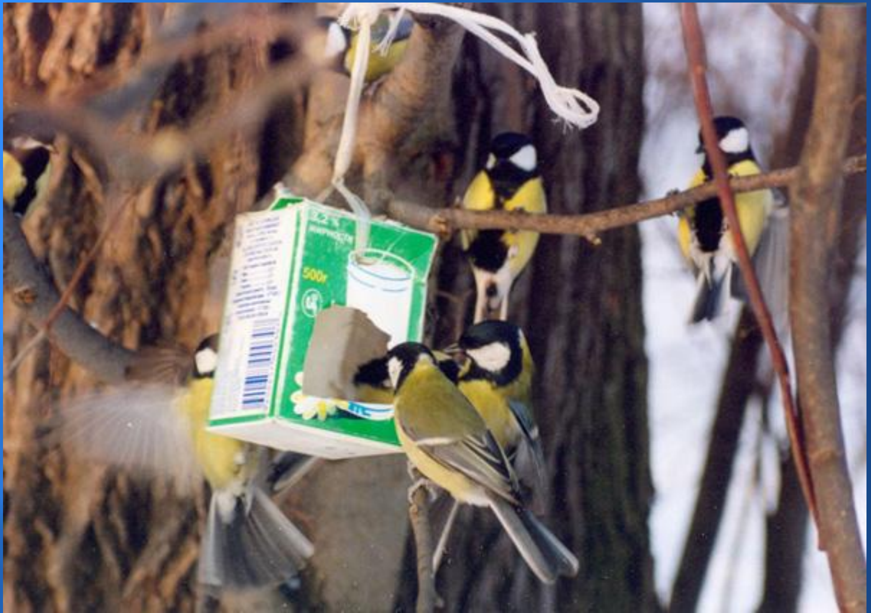
Перед стайкою синиц.