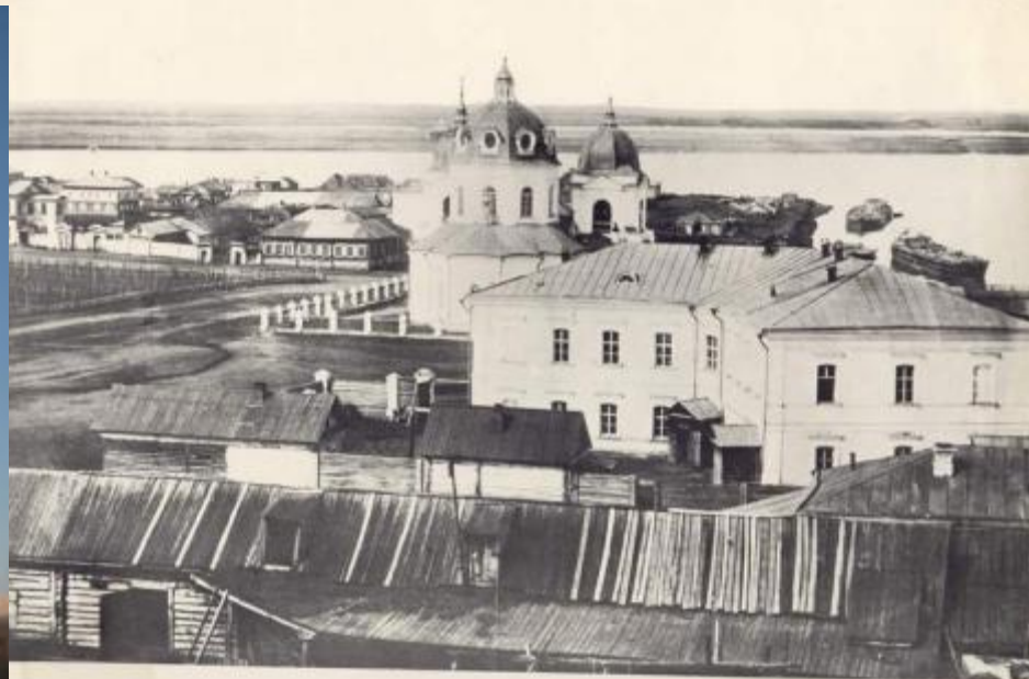
ПАНОРАМА ОМСКА 1863 г.