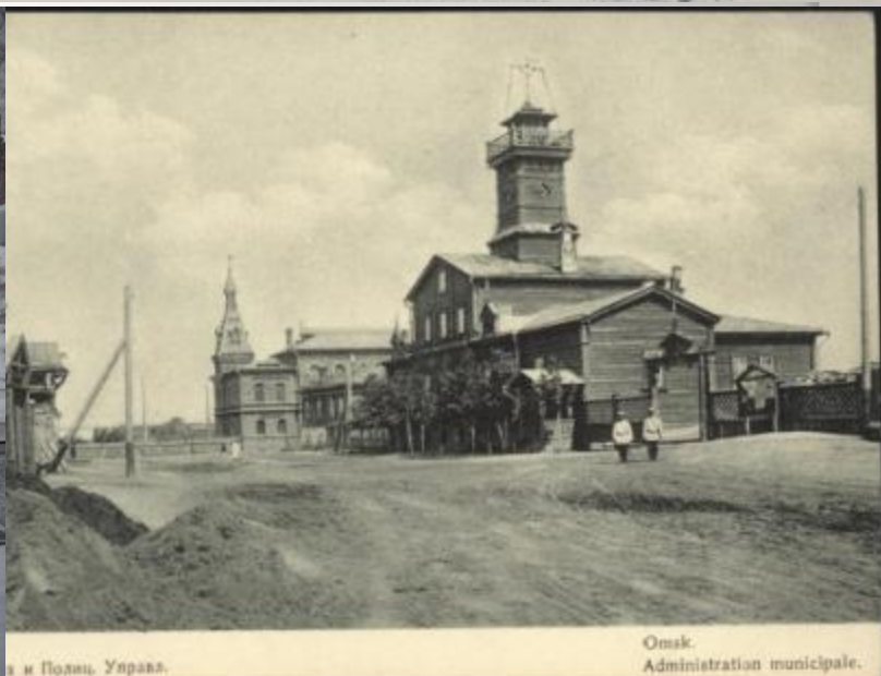
и в Полиц. Управл.