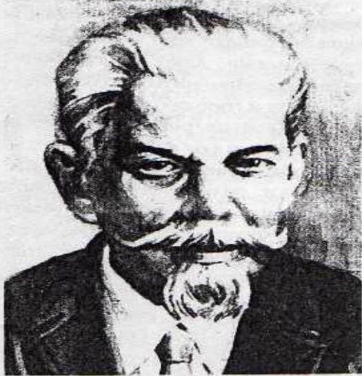
Сергей Иванович Ожегов.