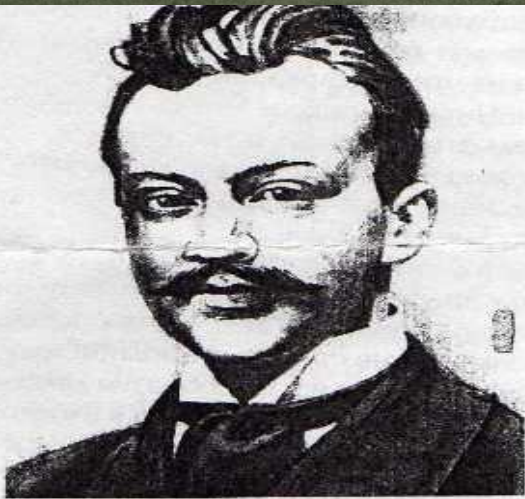
Дмитрий Николаевич Ушаков.