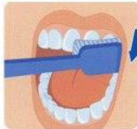
1. Наружные поверхности зубов