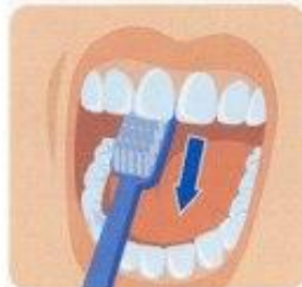
3. Внутренние поверхности передних зубов