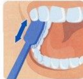
4. Жевательная поверхность зубов