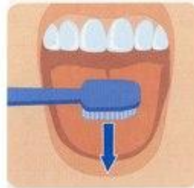
6. Чистка языка