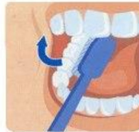
2. Внутренние поверхности зубов