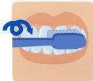
5. Массаж десен