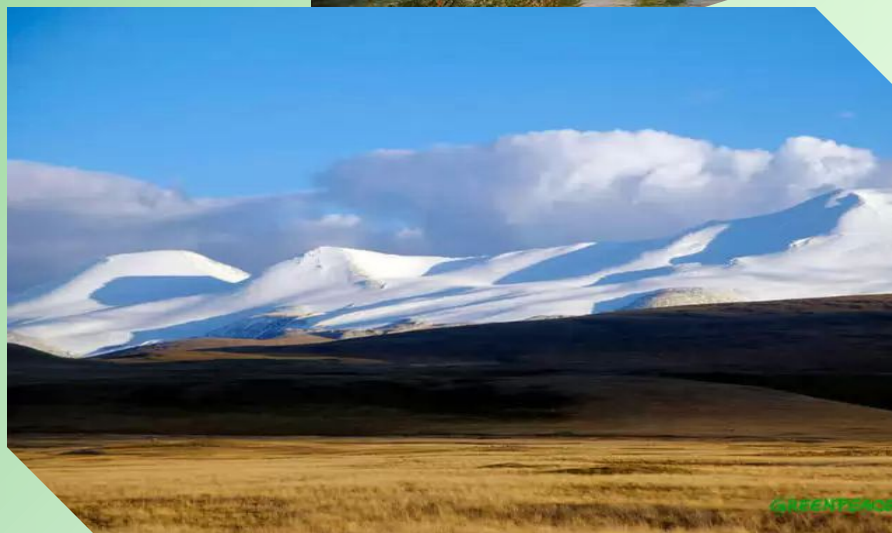
Золотые горы Алтая