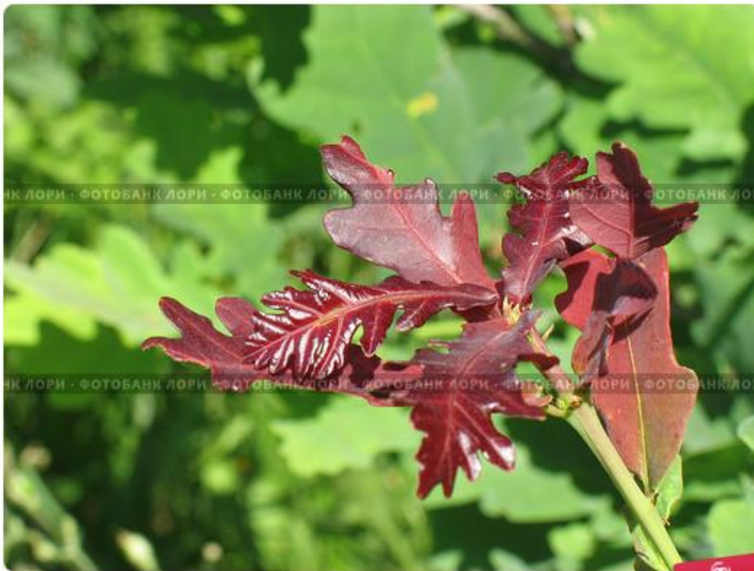
Молодые листья дуба