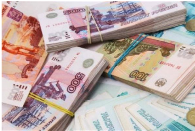
Ден ь ги