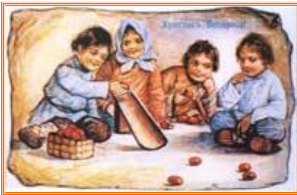
Пасхальная открытка 19 века