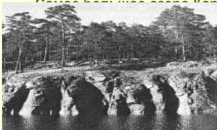
красивые – Валаамские.