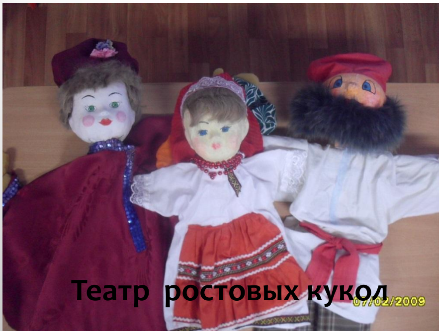
Театр ростовых кукол