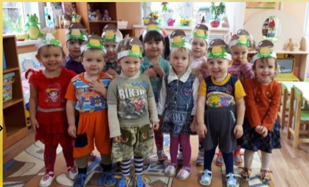
Пальчиковая игра «По грибы»