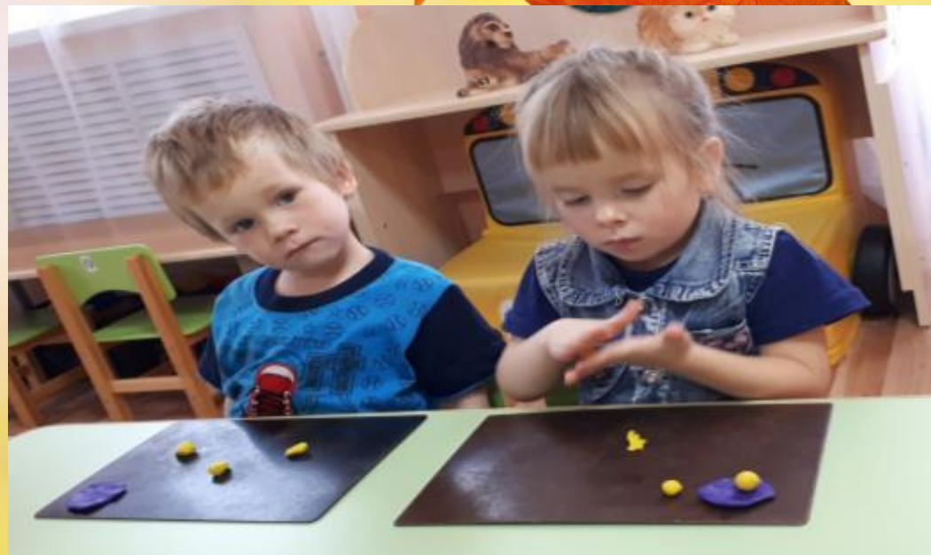
Лепка «Яблочки на тарелочке»