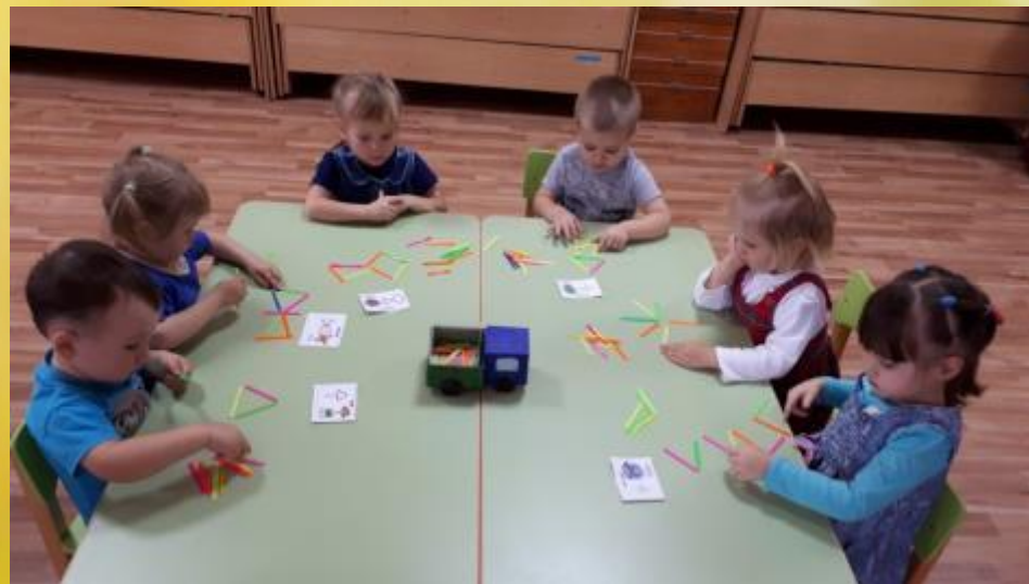
Игры со счетными палочками