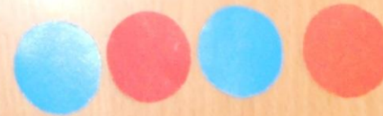
Пеналы для составления схемы слова.