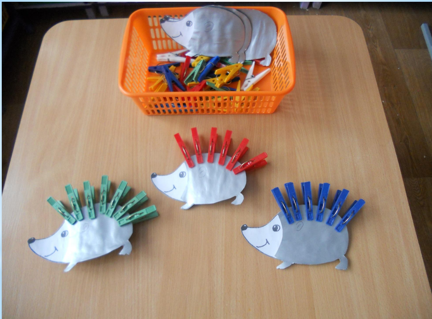
Игры на развитие мелкой моторики.