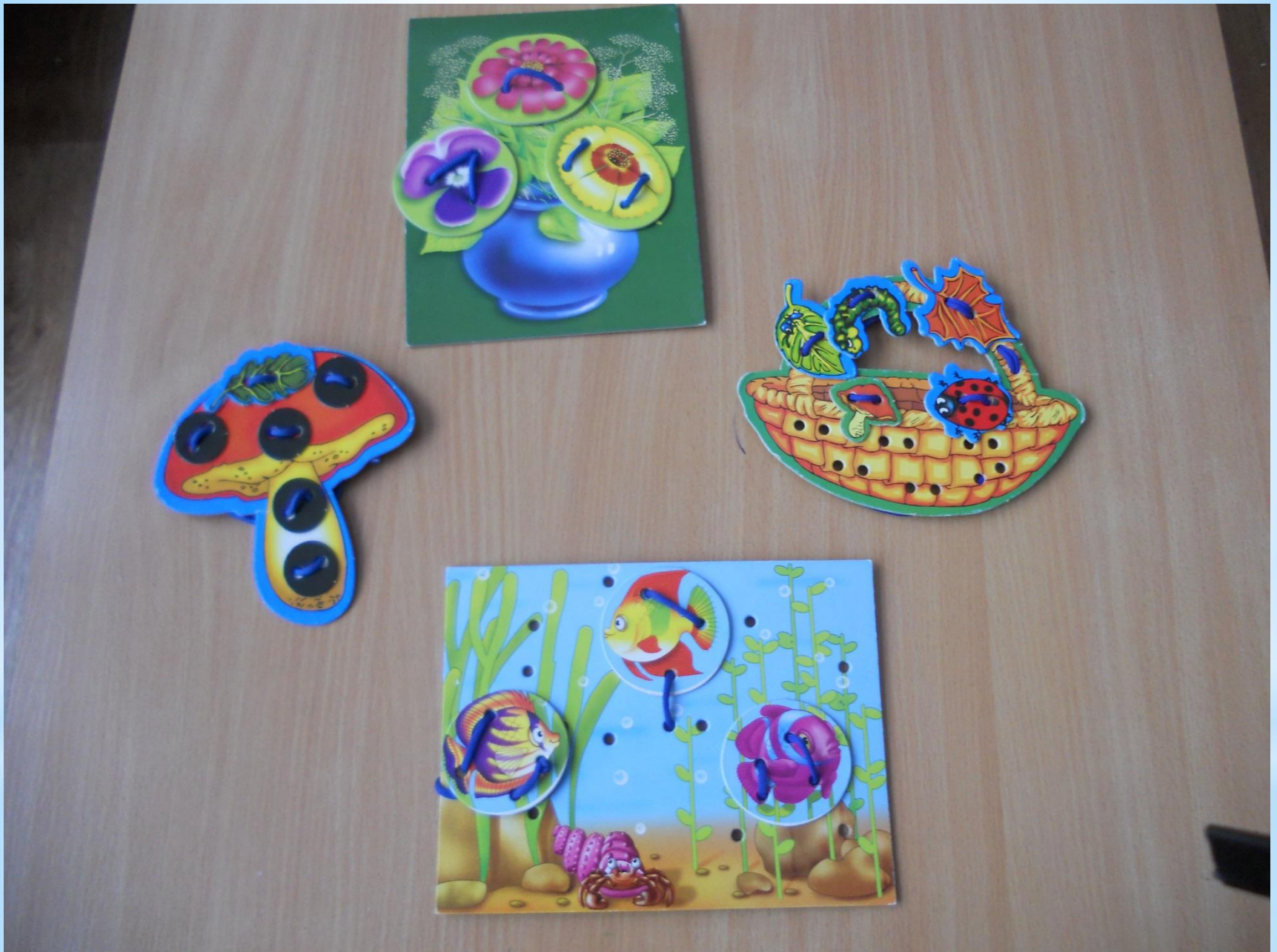
Игры на развитие мелкой моторики «Шнурочки».