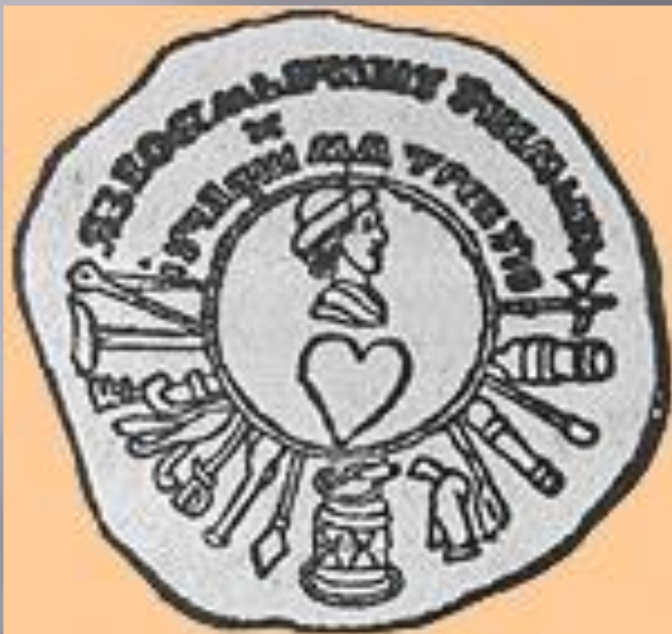
Учебная печать Петра I

"Азь бо есмь в чину учимых и учащих мя требую".