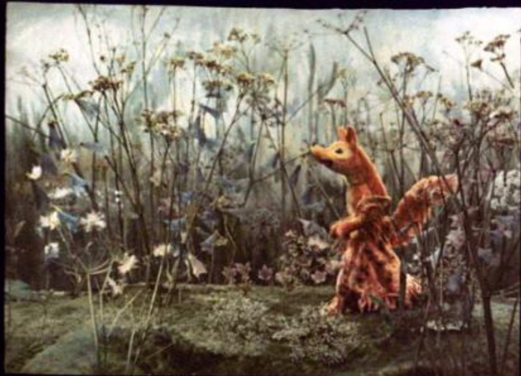
Идёт лисичка-сестричка. 12