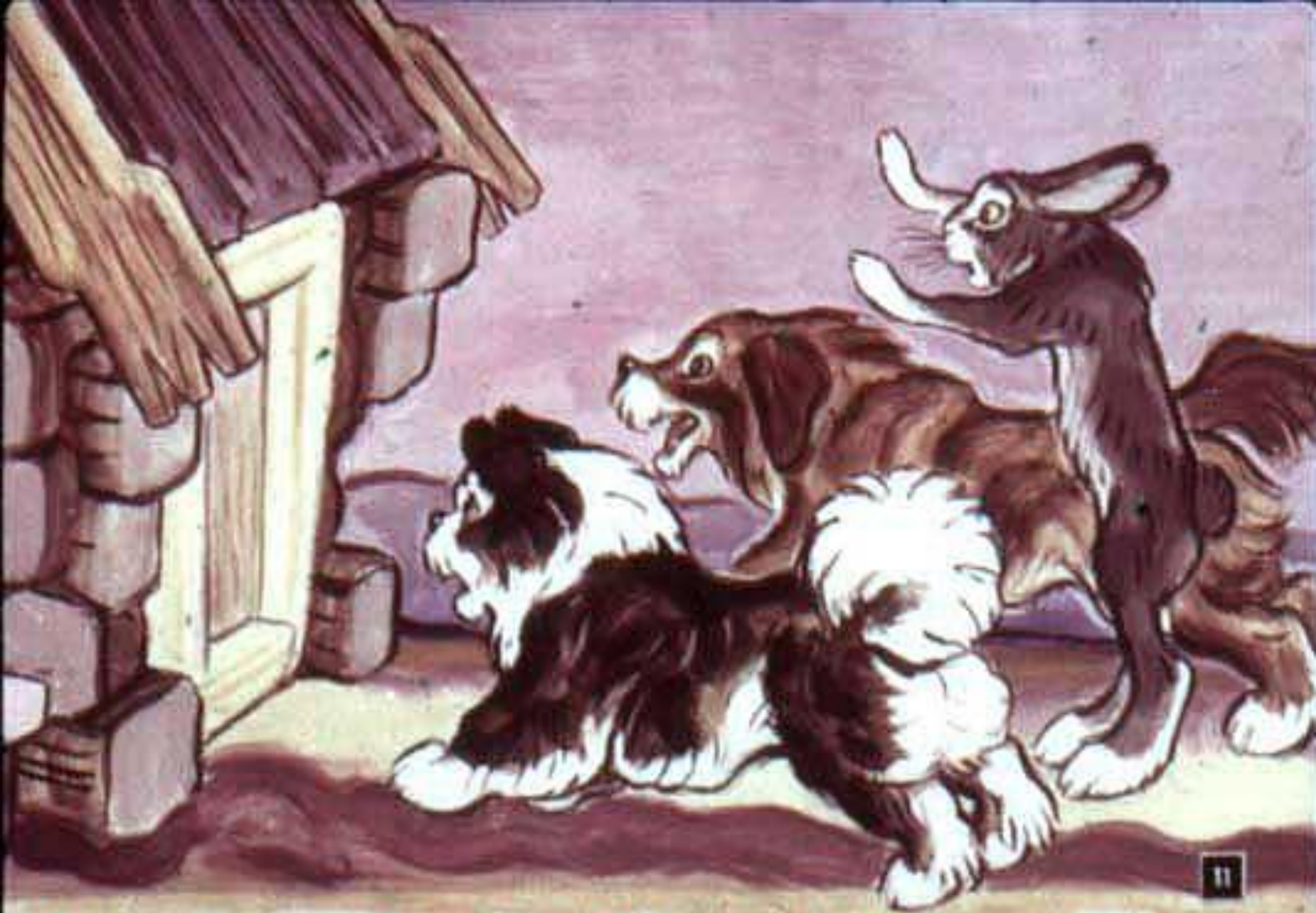
Подошли к избушке: „Тяф-тяф-тяф! Поди, лиса, вон!“