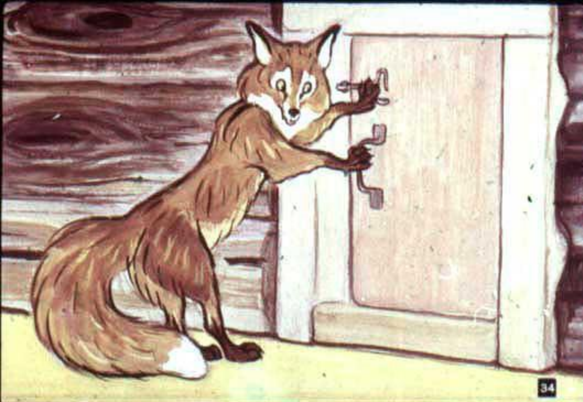
Лиса говорит: „Шубу надеваю... Дверь открываю!“