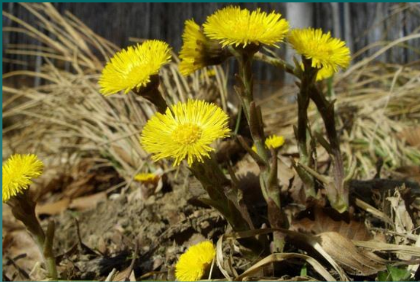
Мать – и – мачеха