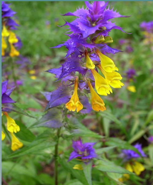
Иван – да – Марья