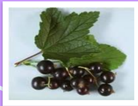
с м о р о д и н а