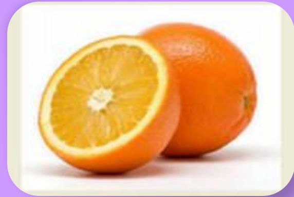
а п е л ь с и н