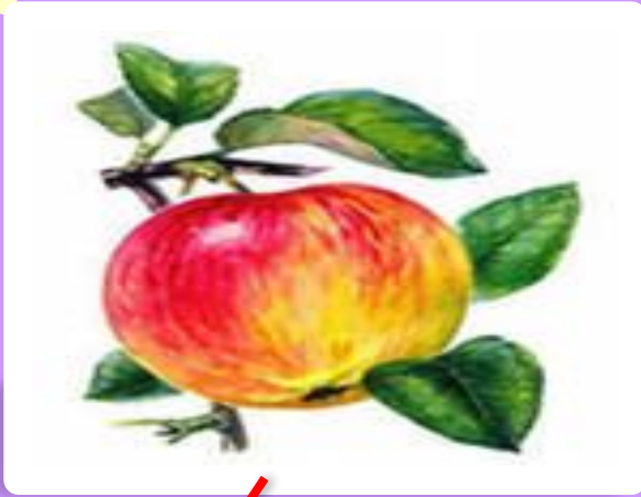
я б л о к о