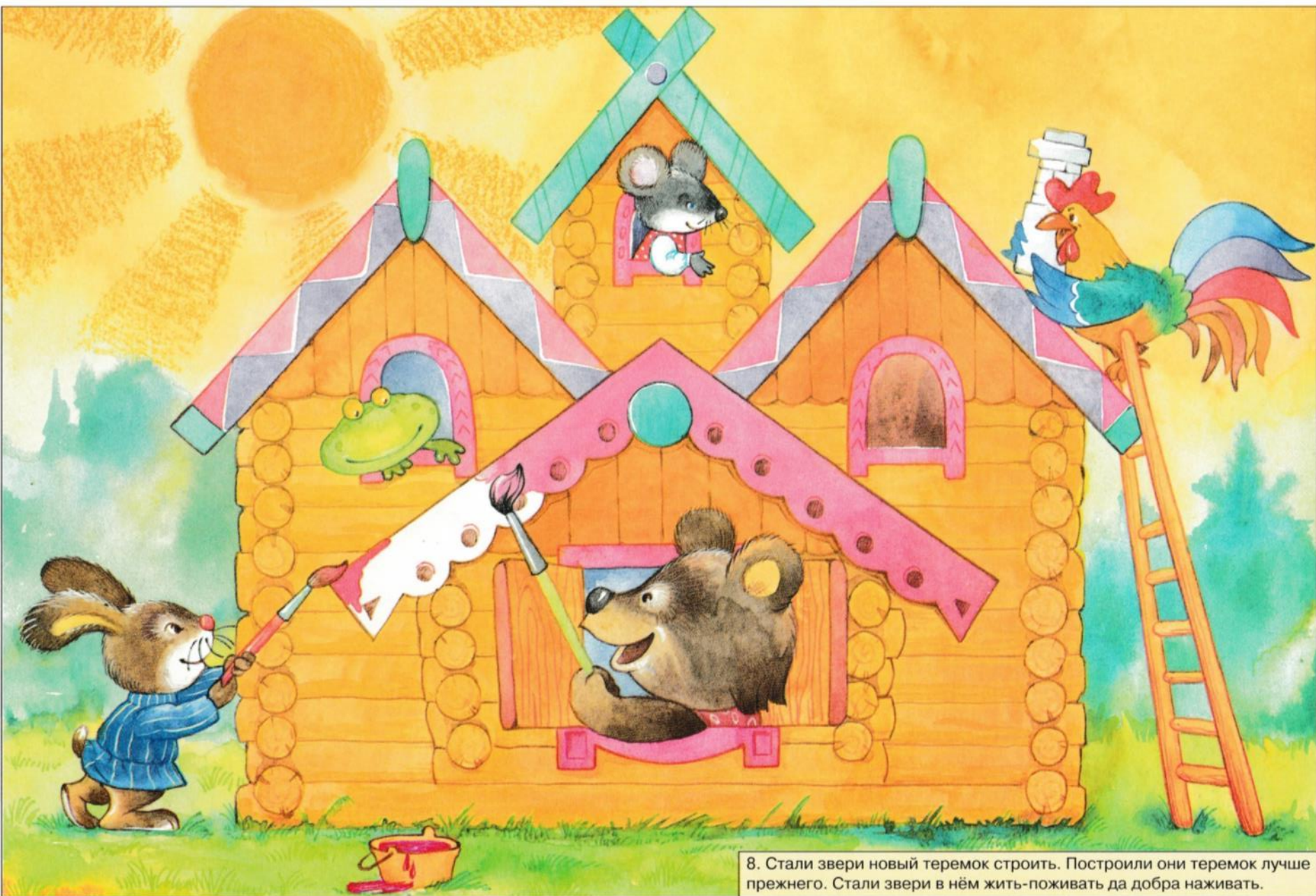
8. Стали звери новый теремок строить. Построили они теремок лучше прежнего. Стали звери в нём жить-поживать да добра наживать.