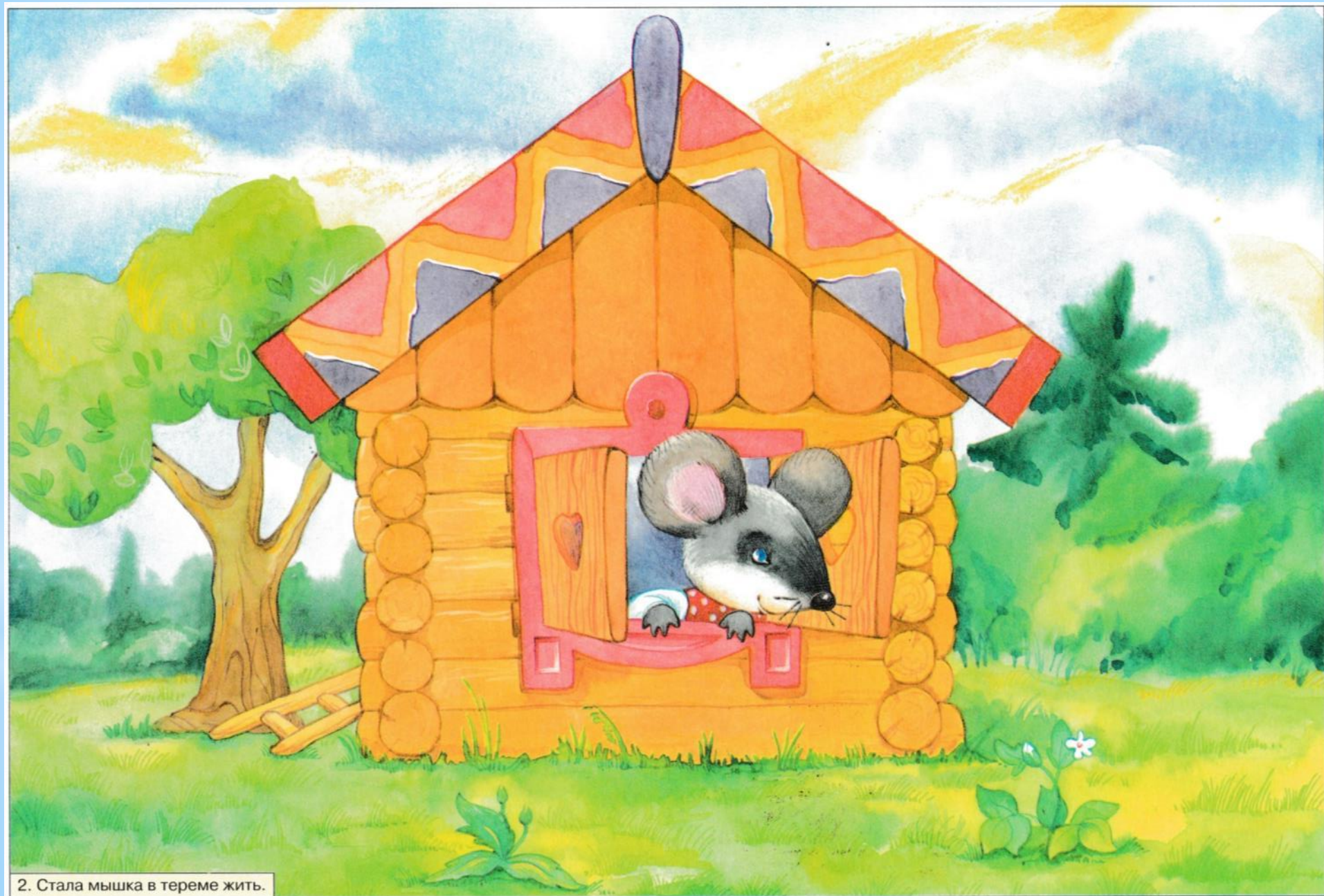
2. Стала мышка в тереме жить.