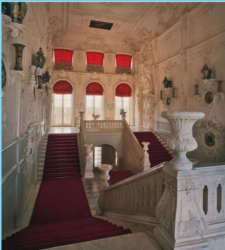
Парадная лестница Екатерининского дворца 2010 г