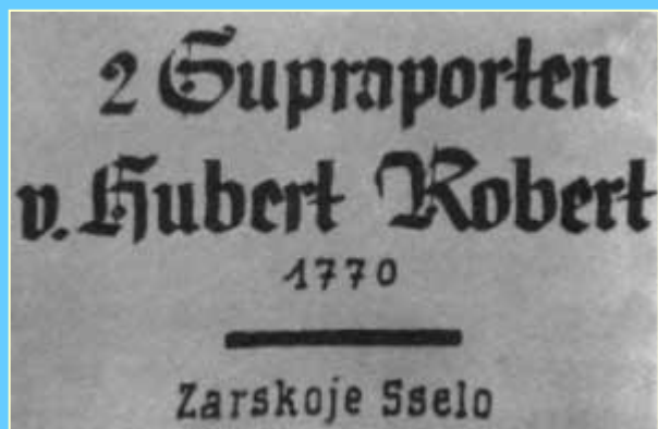
Маркировка художественных ценностей, подготовленных для отправки в Германию