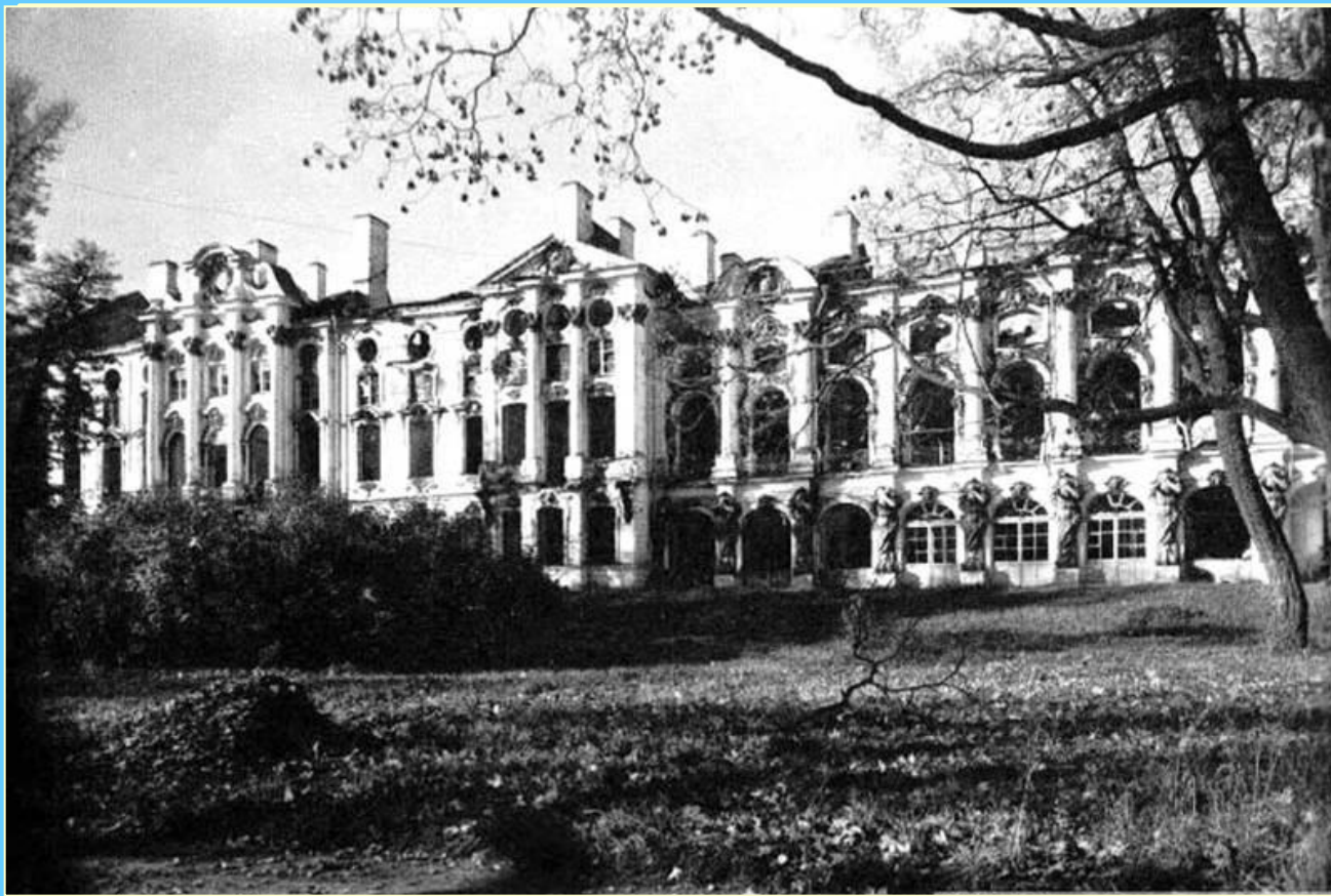
Фасад Екатерининского дворца 1944 год