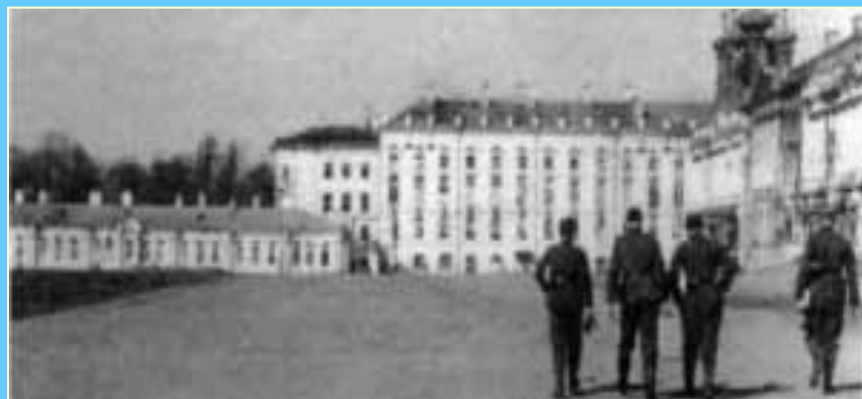
Немецкие солдаты на Парадной площади перед дворцом 1942г