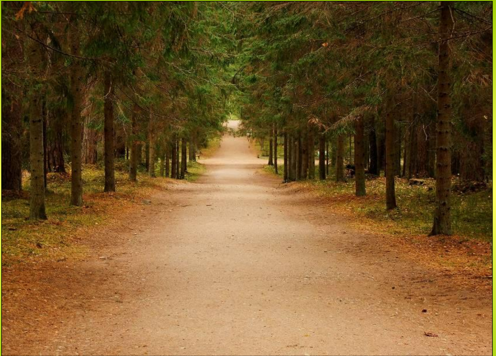
Парк в Михайловском 7