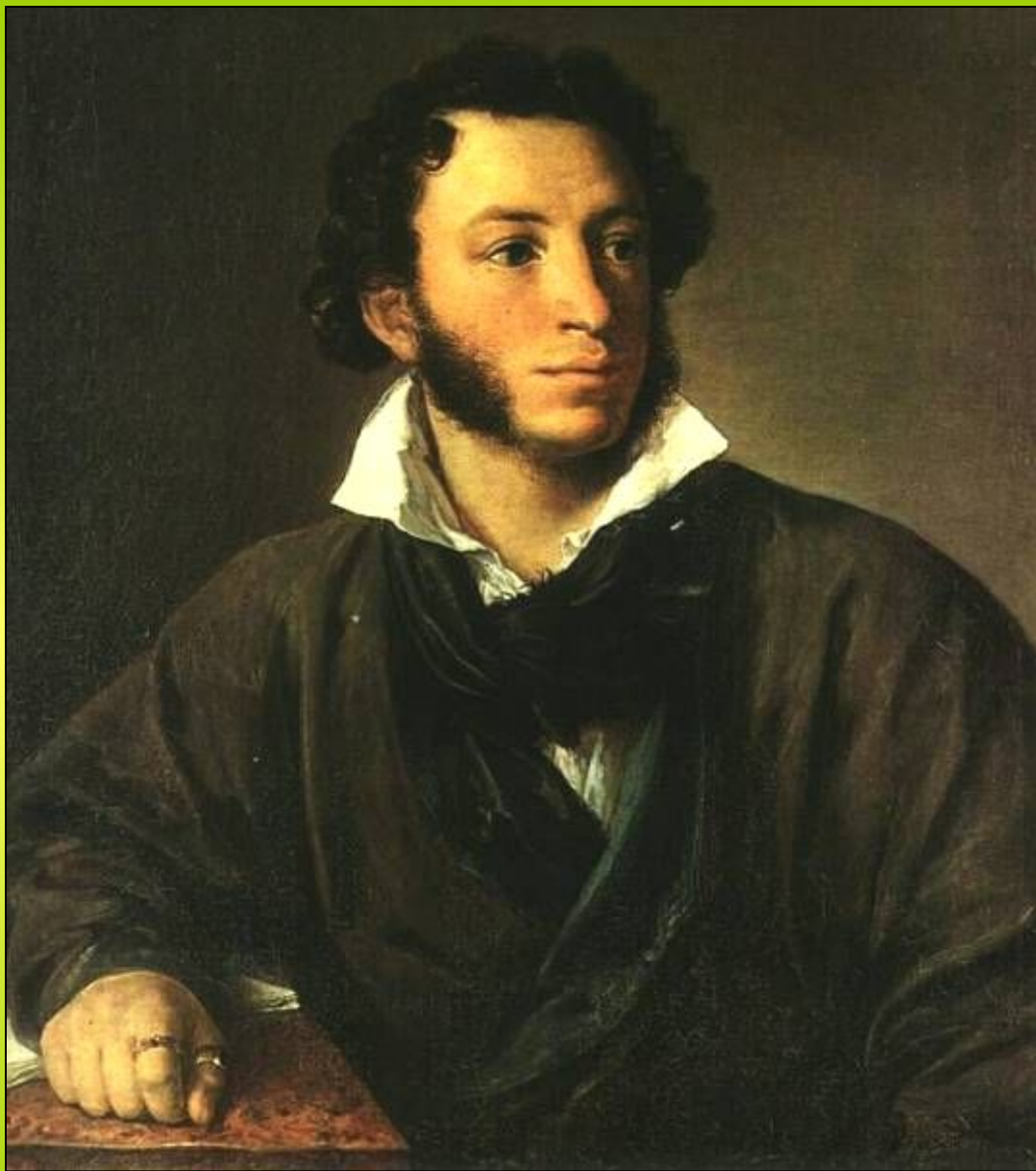
В. А. Тропинин. Портрет А. С. Пушкина (1827)