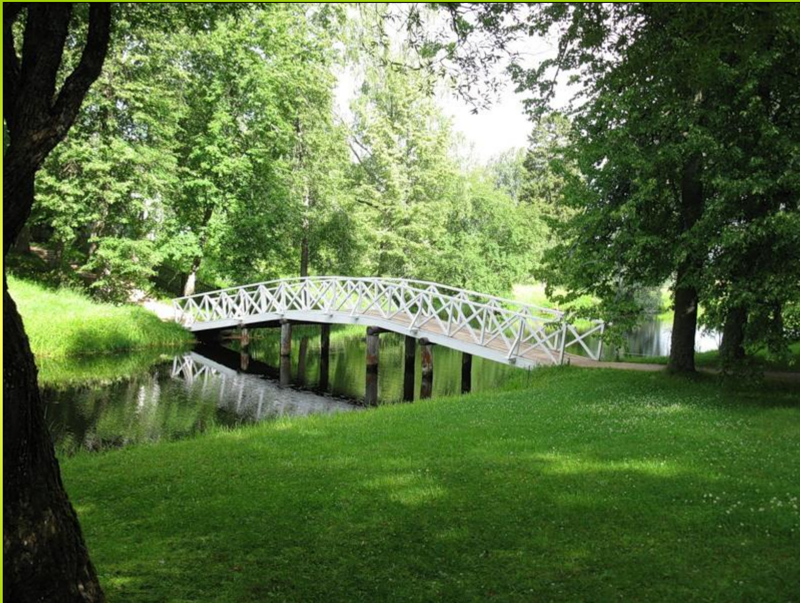
Горбатый мостик 8