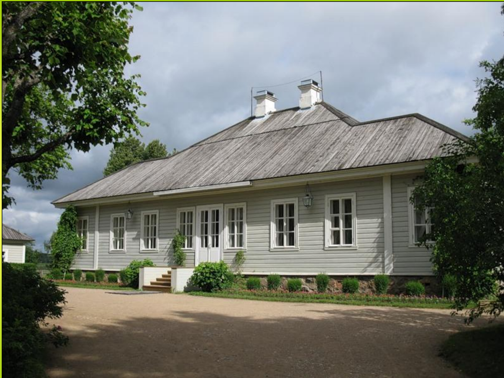
Дом-музей Пушкина 6