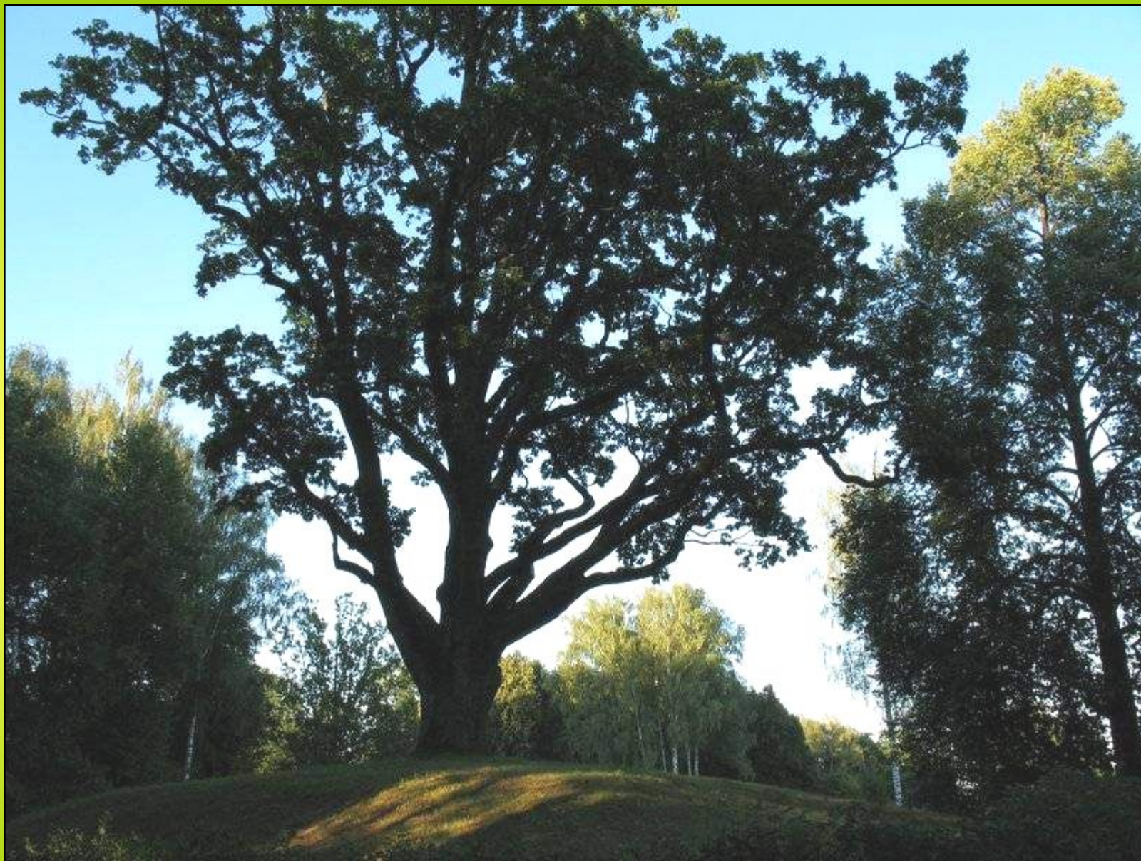
Дуб уединённый 9