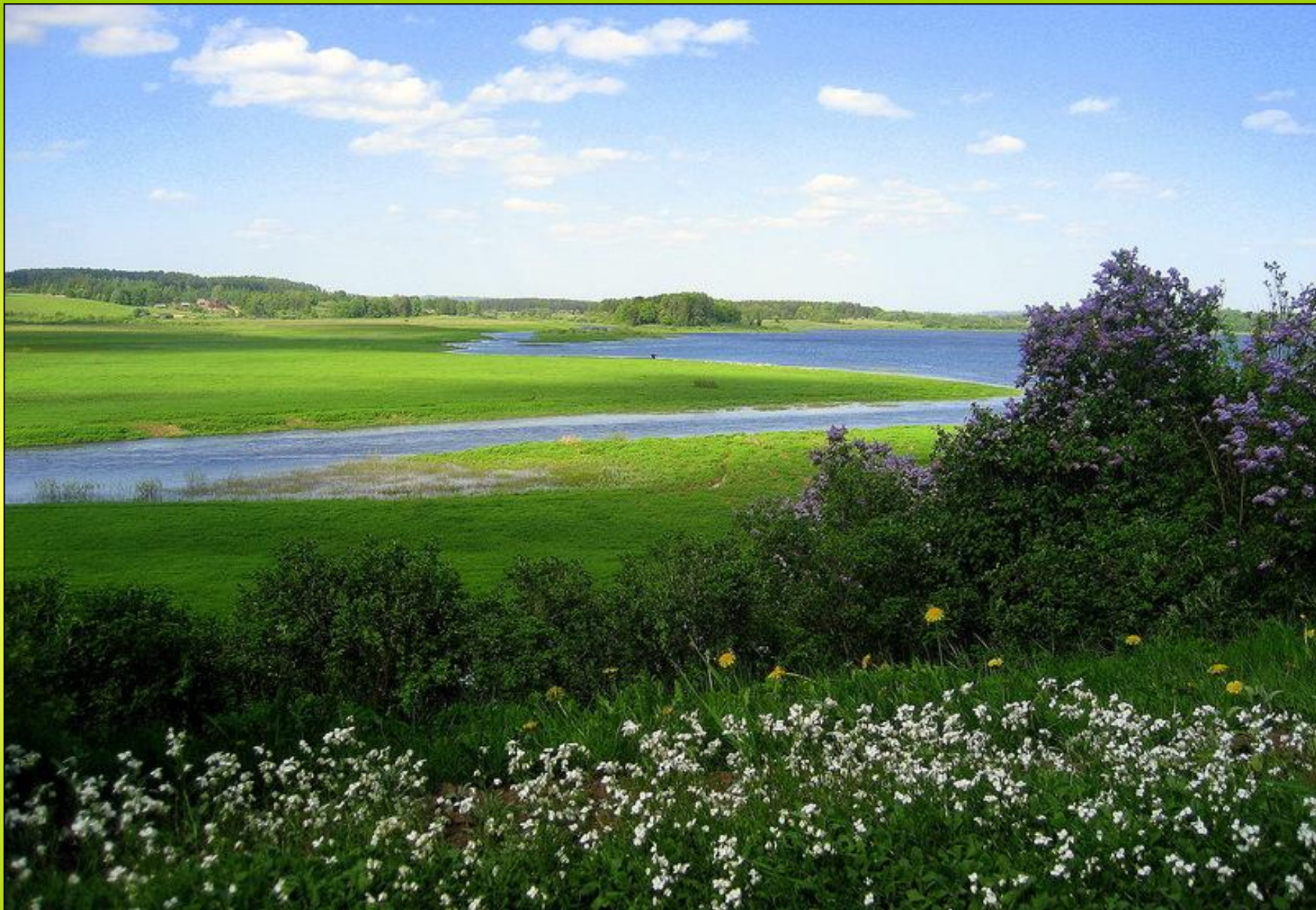
Псковские дали. Река Сор 5 оть