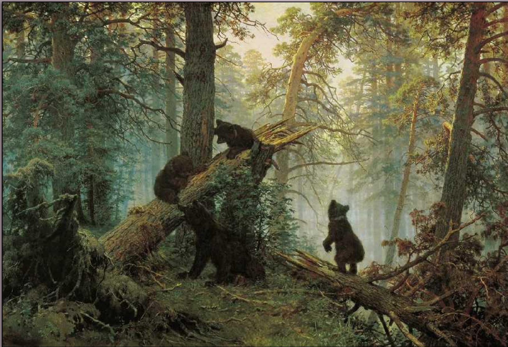
Утро в сосновом лесу , 1889 г.

Это не просто глухой сосновый лес, а именно утро в лесу с его еще не рассеявшимся туманом, с легко порозовевшими вершинами громадных сосен, холодными тенями в чащах. Чувствуется глубина оврага, глушь. Присутствие медвежьего семейства, расположившегося на краю этого оврага, порождает у зрителя ощущение отдаленности и глухости дикого леса.