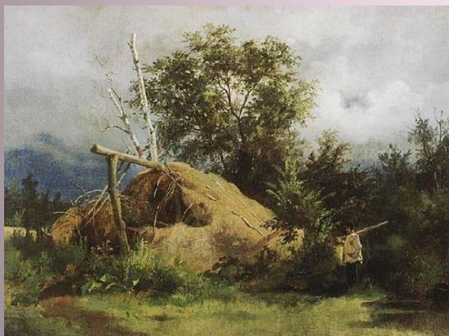
Шалаш, 1861 г.