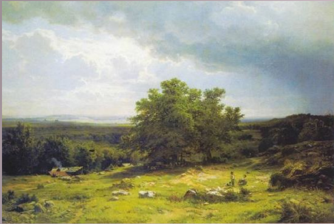
«Вид в окрестностях Дюссельдорфа», 1865