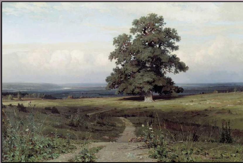
«Среди долины ровныя» ,1883 г.

Успех полотна «Среди долины ровныя» превзошел все ожидания. Привыкшие считать Шишкина «царем леса», «дедушкой лесов», «пейзажистом-лесовиком», зрители увидели перед собой обширную равнину, почувствовали настроение, созвучное тому, которое вызвала песня А. Ф. Мерзлякова, долгое время считавшаяся народной.