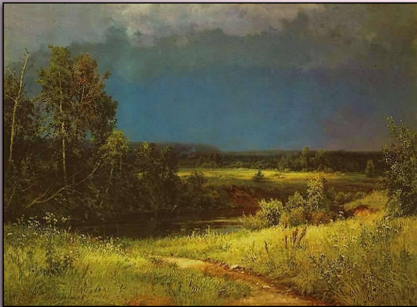
«Перед грозой», 1884 г.

Успех полотна «Среди долины ровныя» превзошел все ожидания. Привыкшие считать Шишкина «царем леса», «дедушкой лесов», «пейзажистом-лесовиком», зрители увидели перед собой обширную равнину, почувствовали настроение, созвучное тому, которое вызвала песня А. Ф. Мерзлякова, долгое время считавшаяся народной.