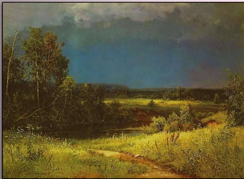
«Перед грозой», 1884 г.

Успех полотна «Среди долины ровныя» превзошел все ожидания. Привыкшие считать Шишкина «царем леса», «дедушкой лесов», «пейзажистом-лесовиком», зрители увидели перед собой обширную равнину, почувствовали настроение, созвучное тому, которое вызвала песня А. Ф. Мерзлякова, долгое время считавшаяся народной.