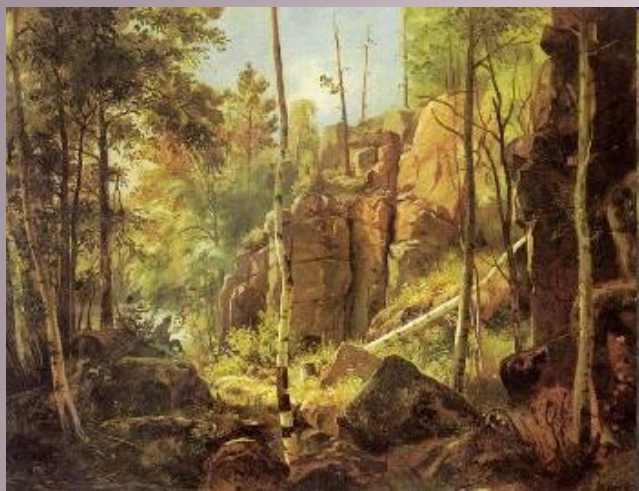
Вид на острове Валаам (местность Кукко), 1859-1860 гг.