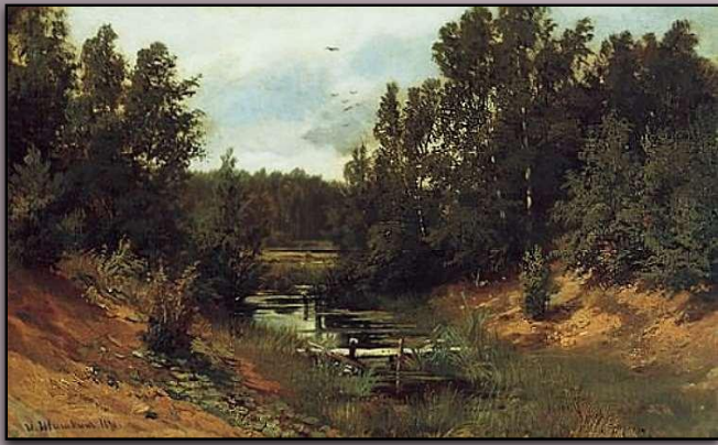
Ручей в лесу, 1870 г.