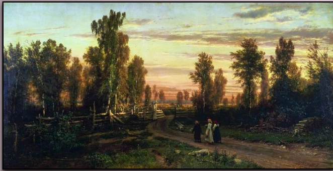
«Вечер», 1871 г.