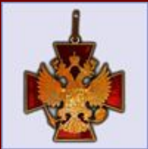
орден "За заслуги перед Отечеством"

Пожарное дело- для крепких парней, Пожарное дело- спасение людей, Пожарное дело-отвага и честь, Пожарное дело- так было и есть!