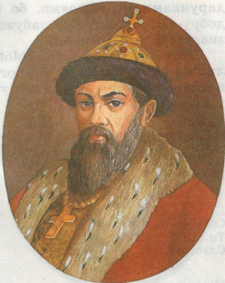
Князь Володимир Мономах

Юный историк: Ни одна эпоха не обходилась без правил и норм человеческого поведения и общения. Об этом можно прочесть в античных стихотворных поучениях, в «Одиссее» Гомера, в памятниках древнерусской литературы. Вот что говорится в «Поучении» Владимира Мономаха, написанном еще в X веке. «Куда ни поедите, где ни остановитесь в пути, везде напоите и накормите всякого просящего; больше всего чтите гостя, откуда бы к вам ни пришел, угостите пищей или питием ... Больного посещайте, мертвого падите проводить так, как все мы смертны. Не пройдите мимо человека, не приветствуя его, а скажите всякому при встрече доброе слово ..»