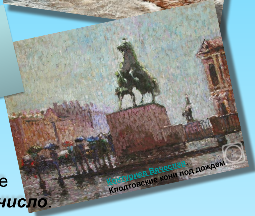
Конзуриев Вячеслав Клодтовские кони под дождем

Ну и ветер жмёт с залива! Дождик хлещет всё сильнее, И насквозь промокли гривы Старых клодтовских коней.