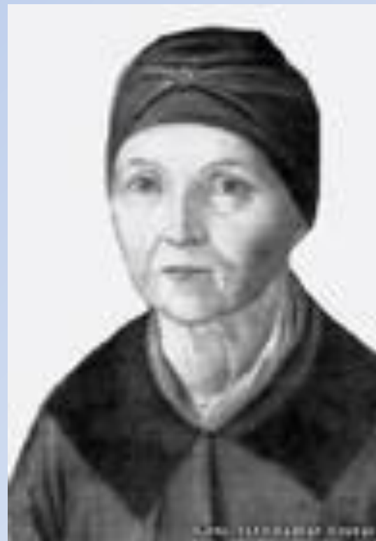
Яковлева Арина Родионовна

Она, быть, верная, «подруга дней суровых», опальный, поэт.