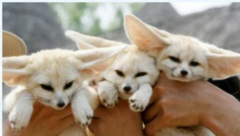
Лисички — лесные звери

ОМОНИМЫ — это слова, одинаковые по звучанию, но совершенно разные по лексическому значению